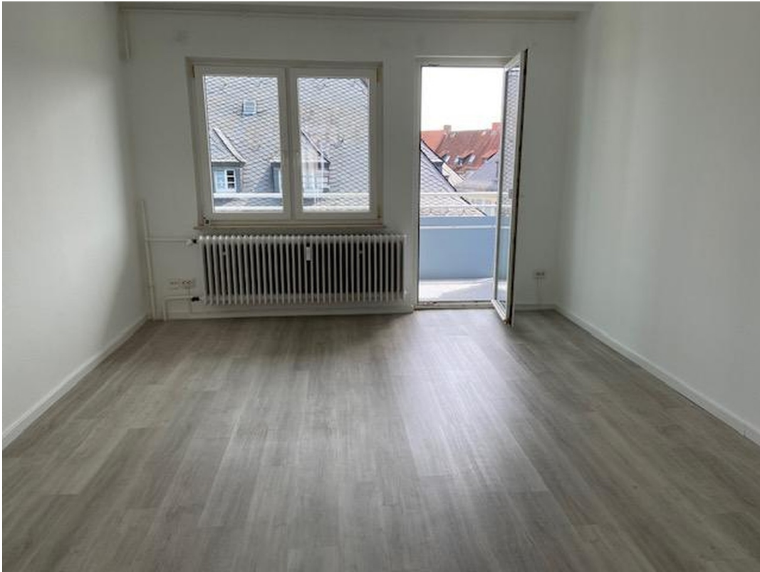
SZ/WZ Blick zum Balkon