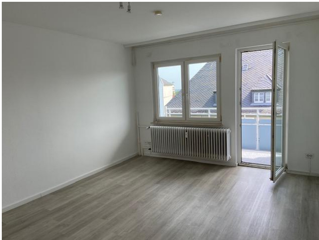
Blick zum Balkon