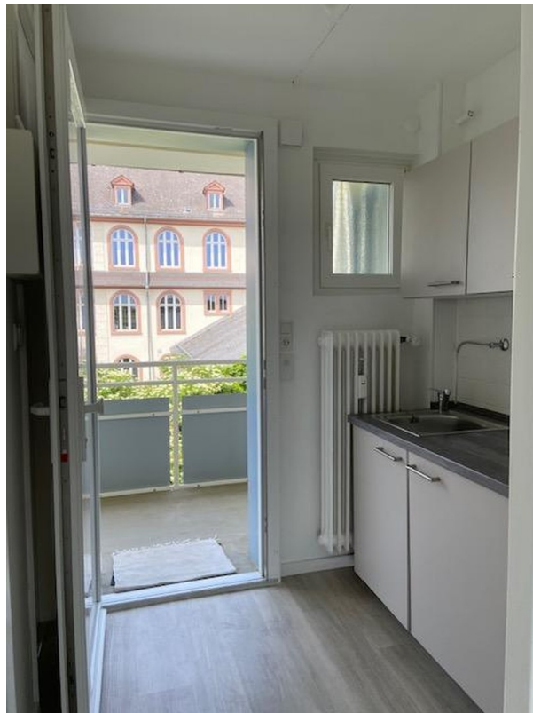
Blick Richtung Eingangstür