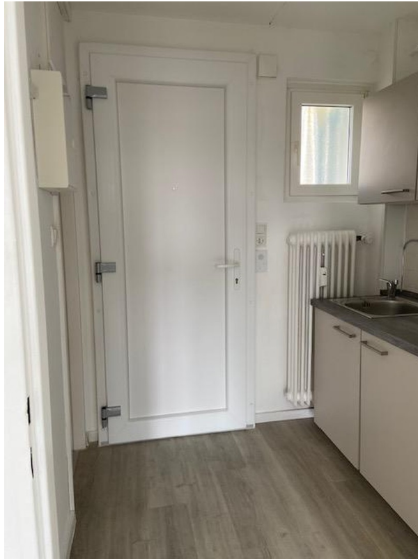
EinTür m.3-fach Verriegelung