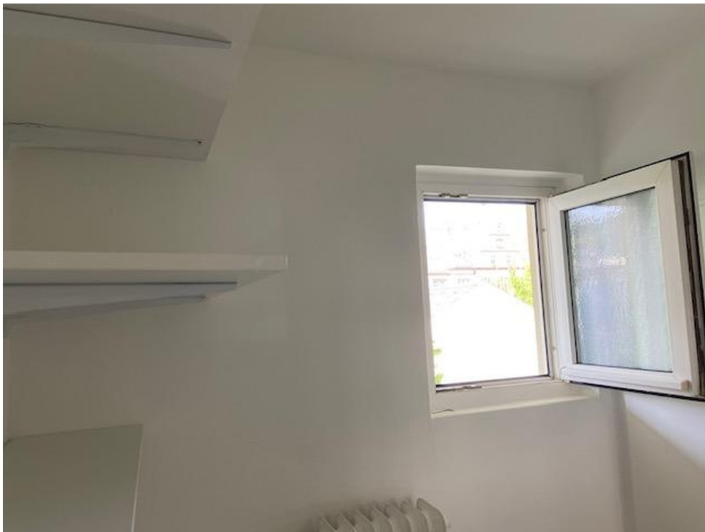
Dusche/WC mit Fenster