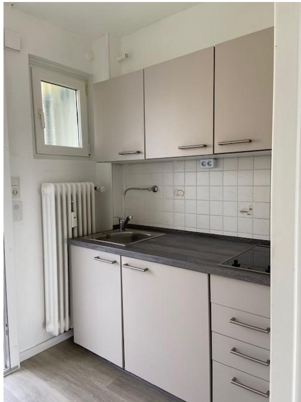
Küche mit Fenster