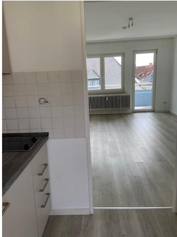
Küche Blick Richtg.SZ/WZ