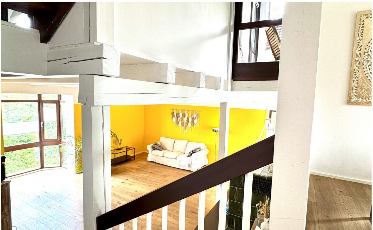
Blick Essbereich Wohnzimmer