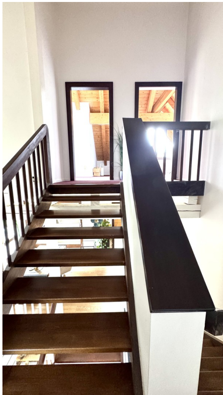
Aufgang Eltern SZ zu Kinder