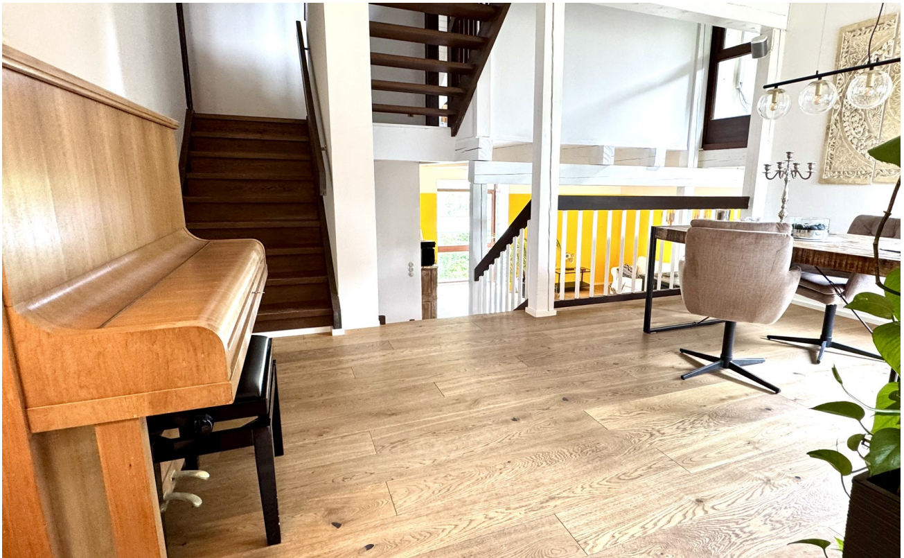
Essbereich Blick Wohnzimmer