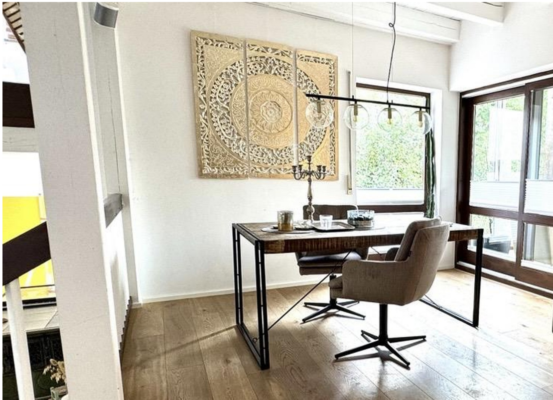
Essbereich, Blick Wintergarten