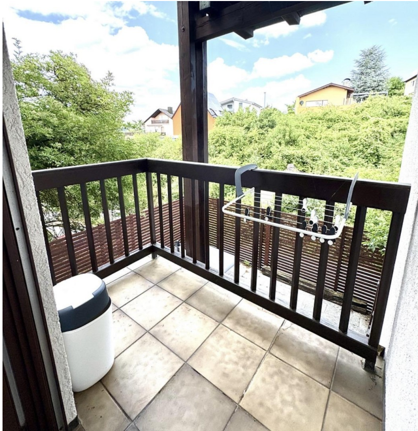
Balkon Gäste WC