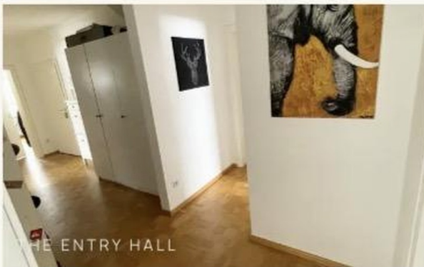
THE ENTRY HALL