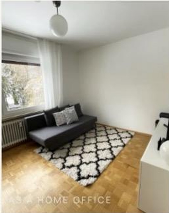
AS A HOME OFFICE