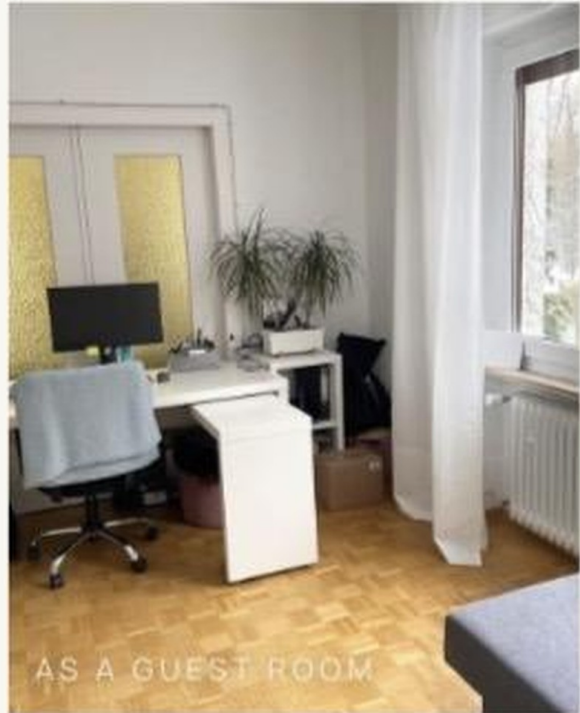
AS A GUEST ROOM