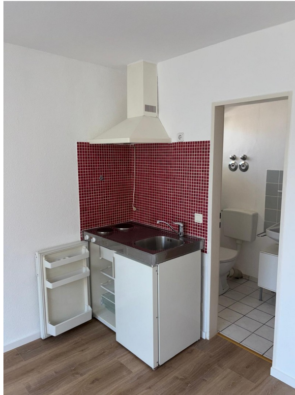
Wohnzimmer mit Kochnische