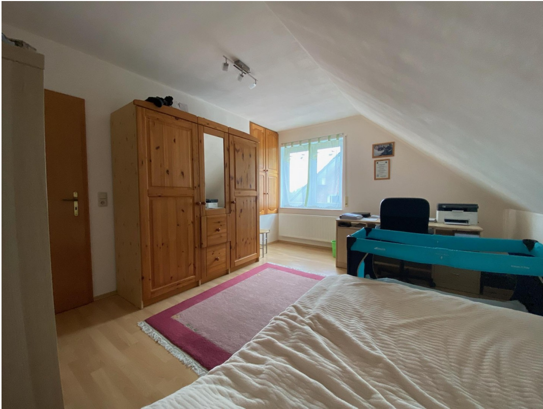
Zimmer 1 Obergeschoss