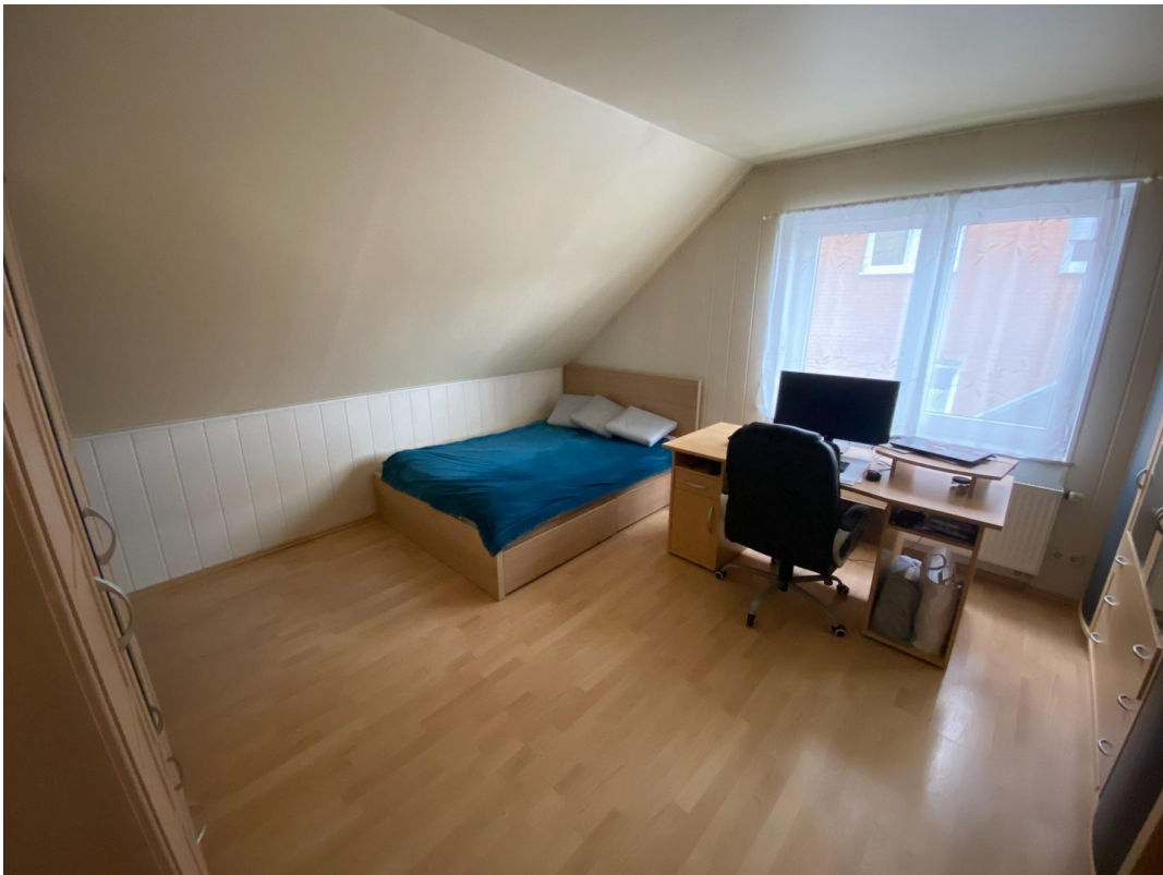
Zimmer 2 Obergeschoss