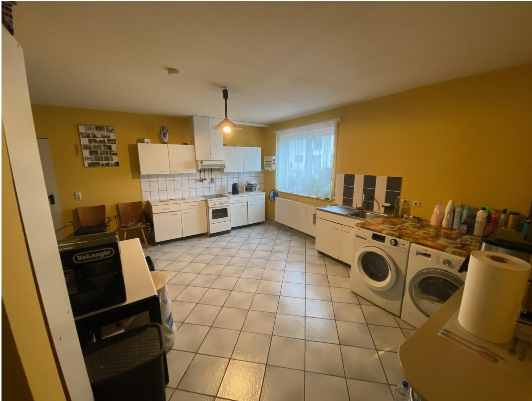
Keller mit 2. Kellerraum