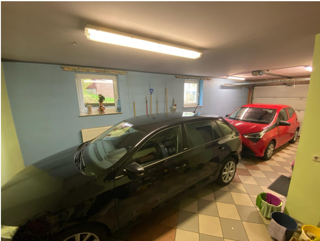
Garage für zwei Autos