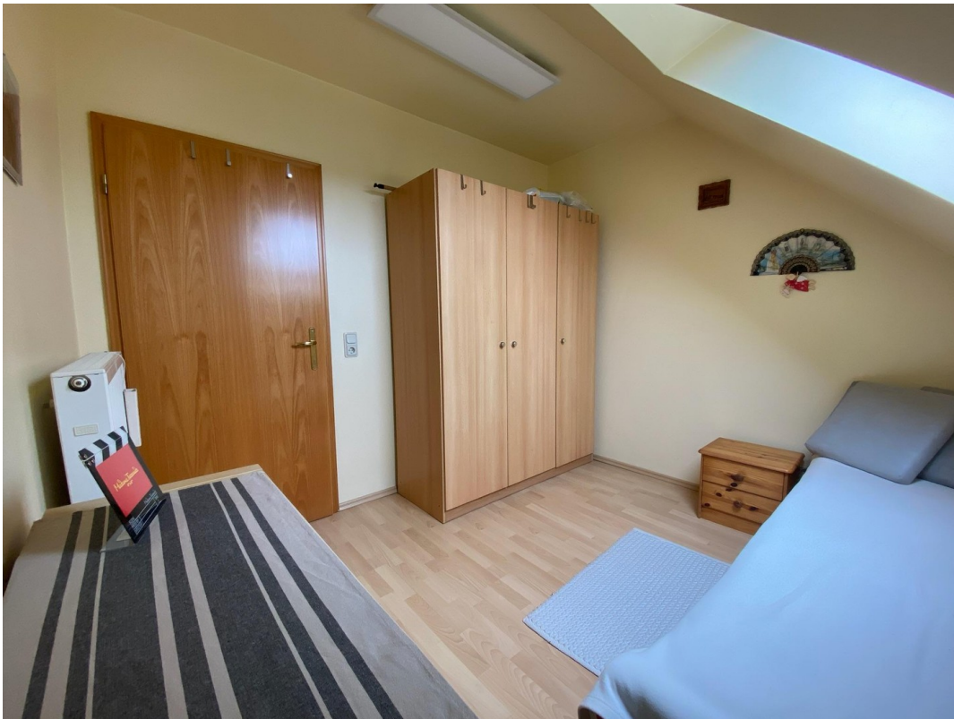
Zimmer 4 Obergeschoss