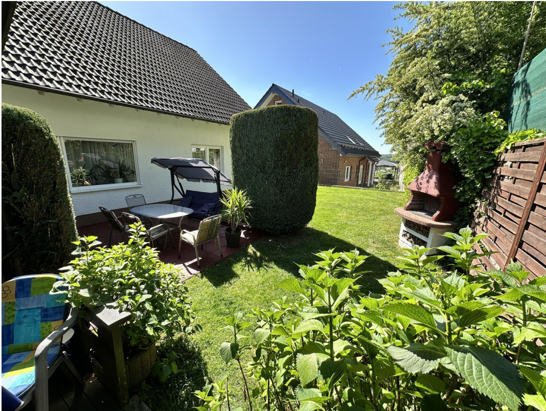
Ansicht aus der Gartenlaube