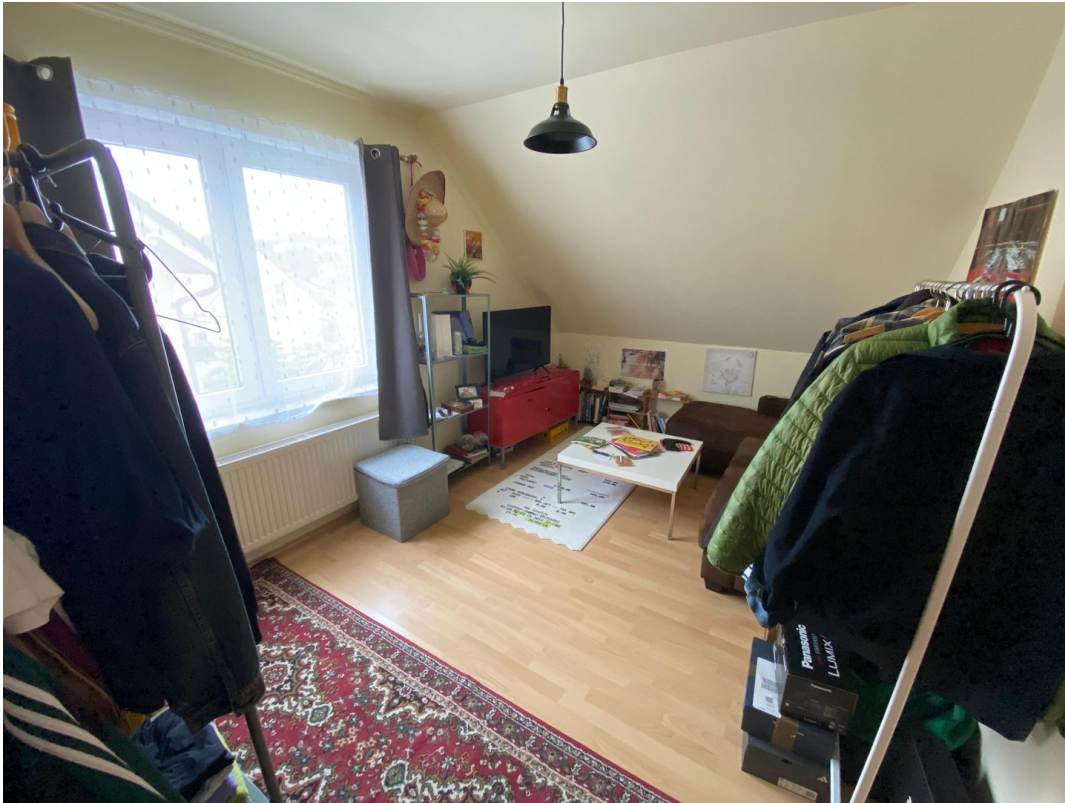
Zimmer 3 Obergeschoss