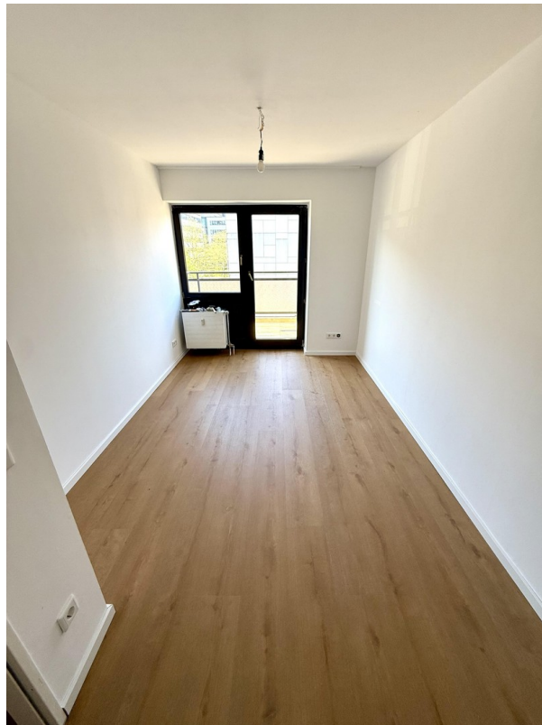
Wohn/Esszimmer (noch leer)