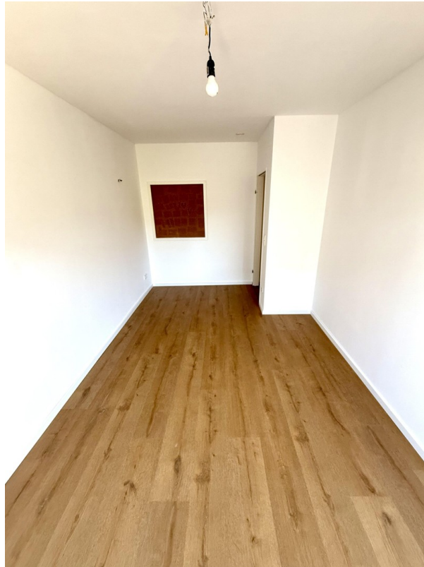
Wohn/Esszimmer (noch leer)