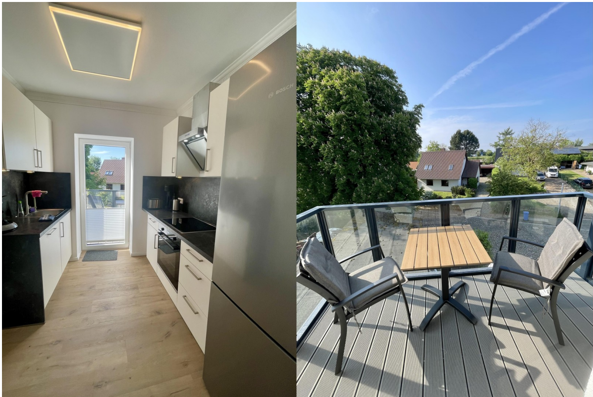
Küche und Balkon