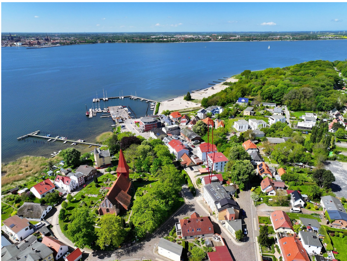
Lage Seebad Altefähr - Rügen