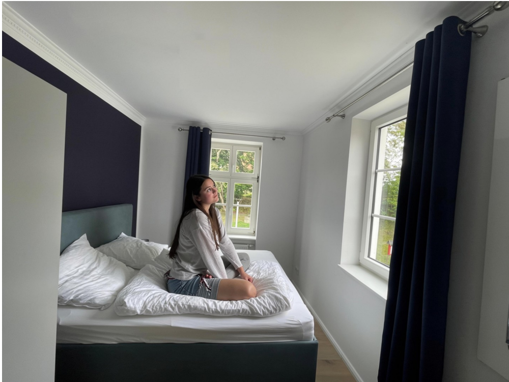
Schlafzimmer mit Seeblick