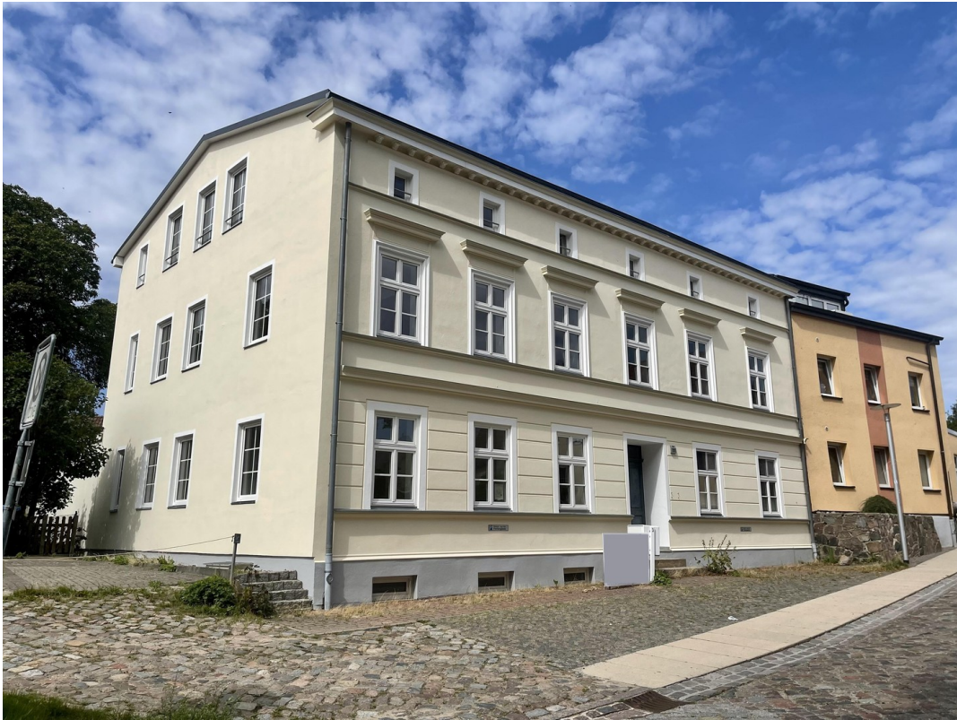
Giebel Blick zum Hafen