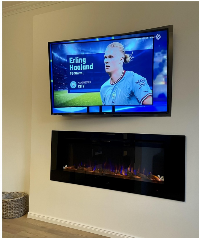
E-Kamin als TV-Wand