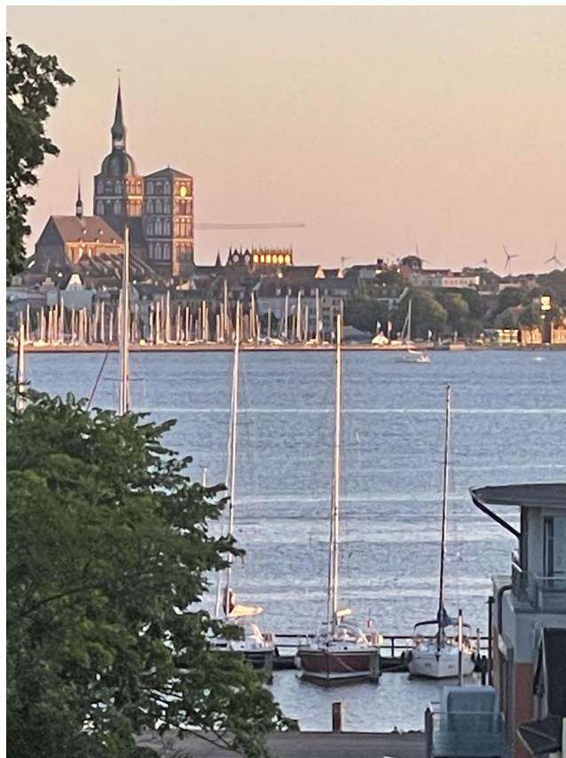
Seeblick auf Stralsund