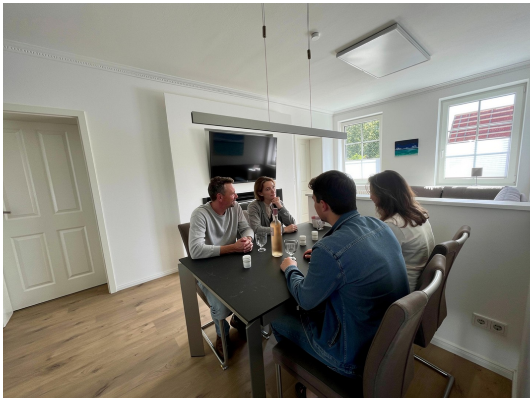
Wohn- & Essen