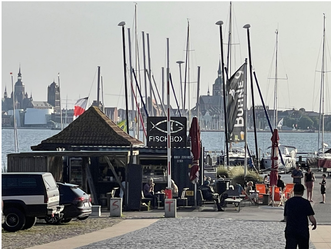
Fischbox & Buhne 9