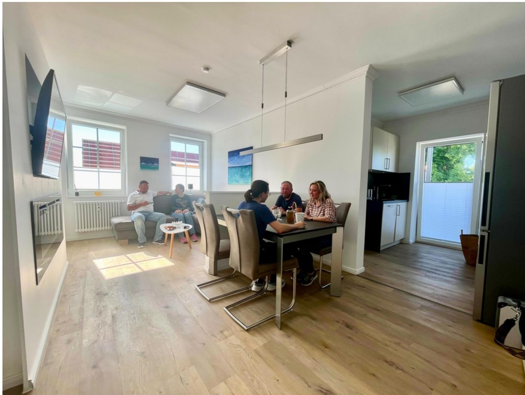
offen Wohn- & Essen