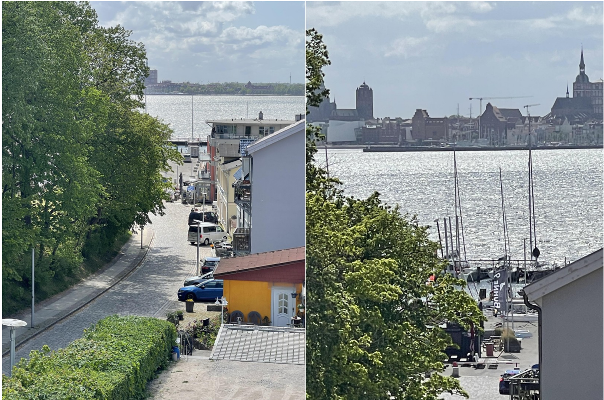
Seeblick auf den Hafen