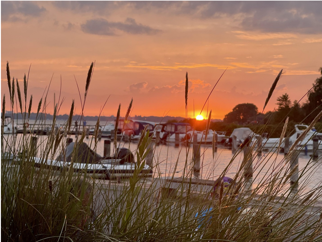
Sonnenuntergang im Hafen