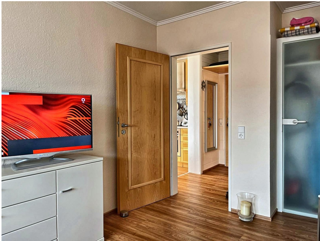
Wohnzimmer / Flur