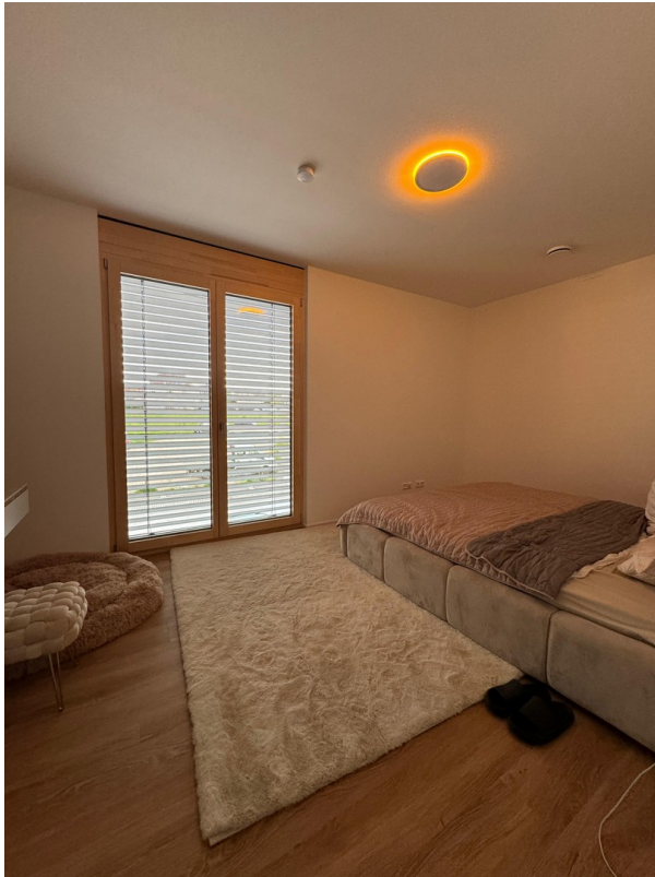
Schlafzimmer 1 eingerichtet