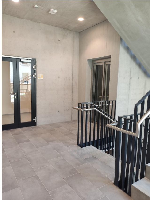
Eingang mit Aufzug