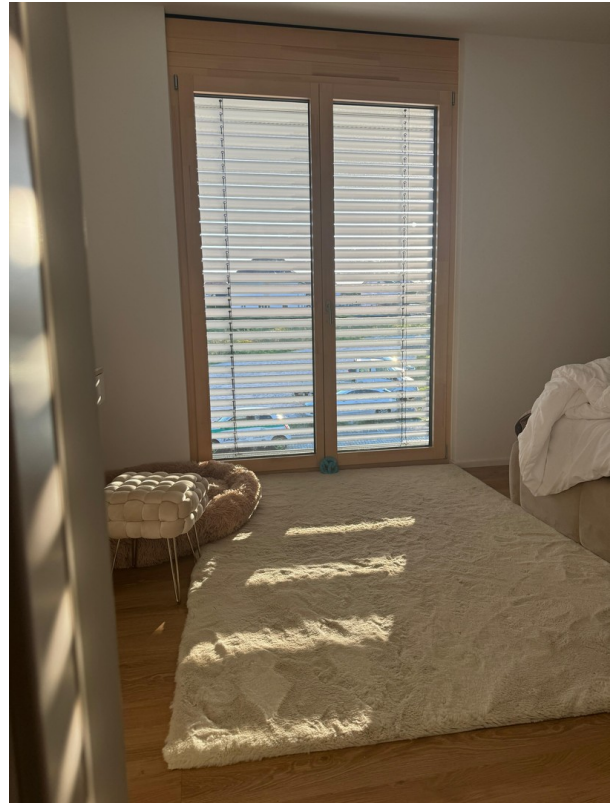
Schlafzimmer 1 eingerichtet