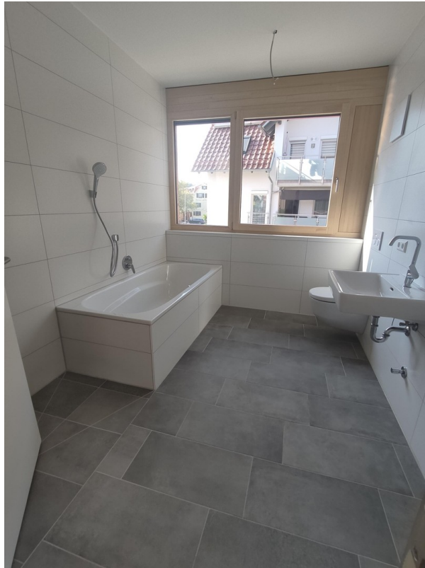
Hauptbad mit Wanne und Dusche