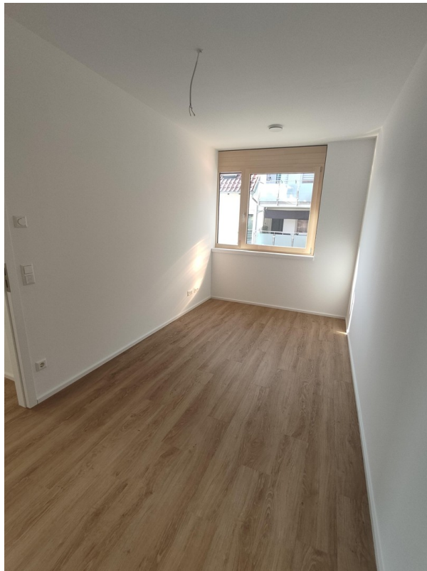
Schlafzimmer 2 oder Büro