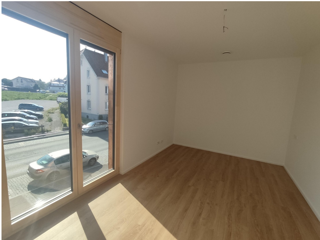
Schlafzimmer 1 leer