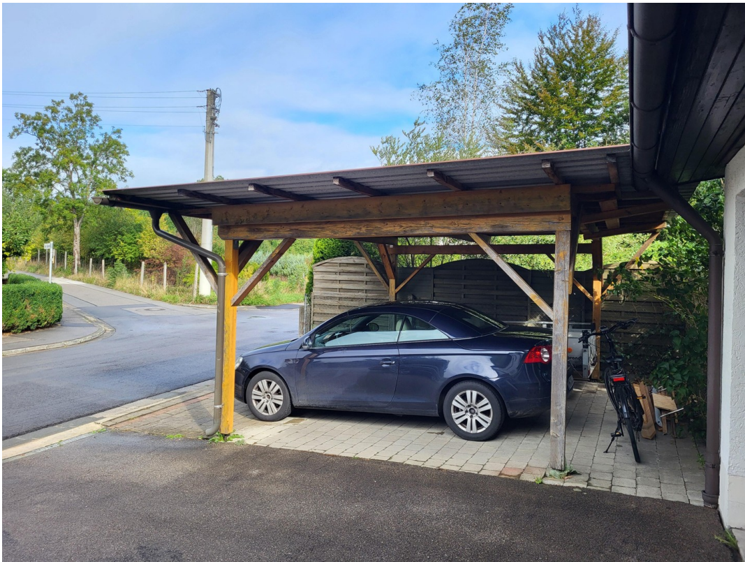
Carport - 2 Stellplätze