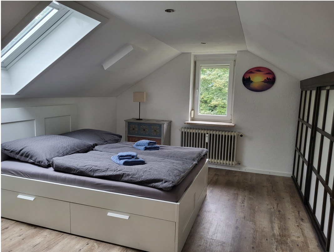
Schlafzimmer 2 - mit Rollo