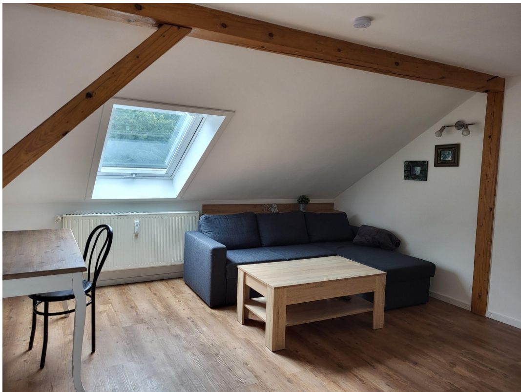
Dachfenster mit Verdunkelung