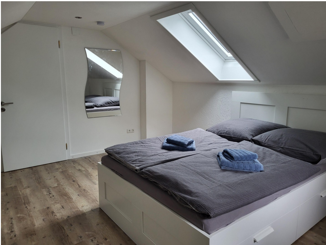
Dachfenster mit Verdunkelung