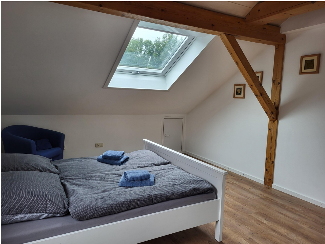
Dachfenster mit Verdunkelung