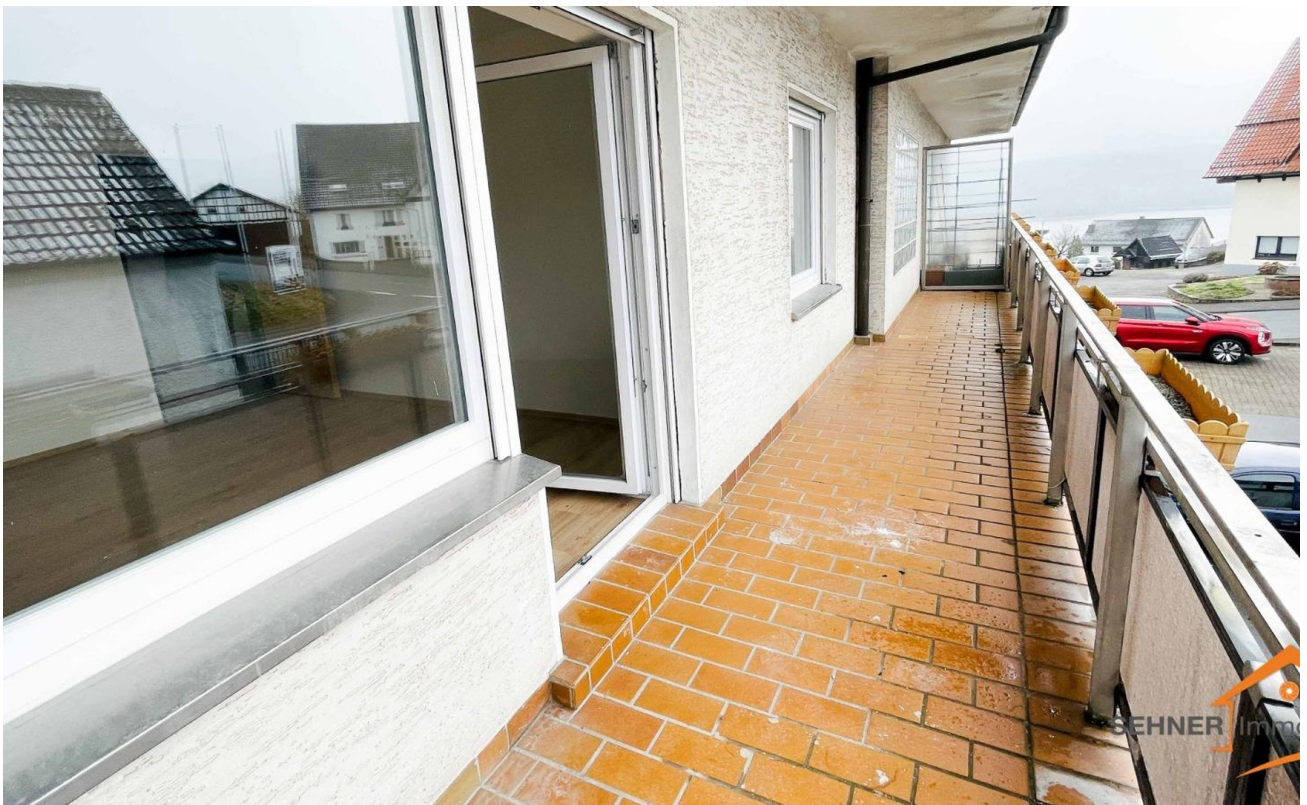
Balkon wird neu in 2026