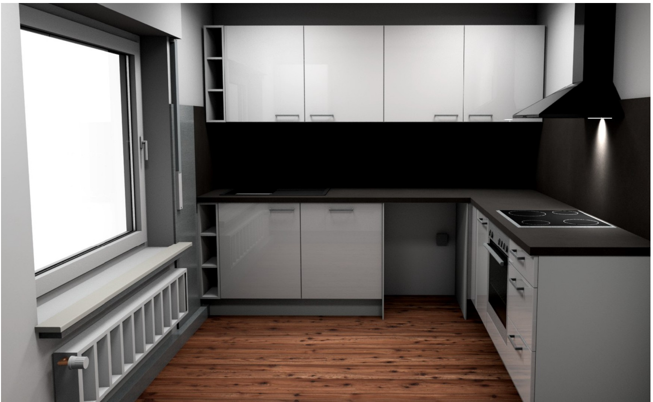
Finale Planung der Küche