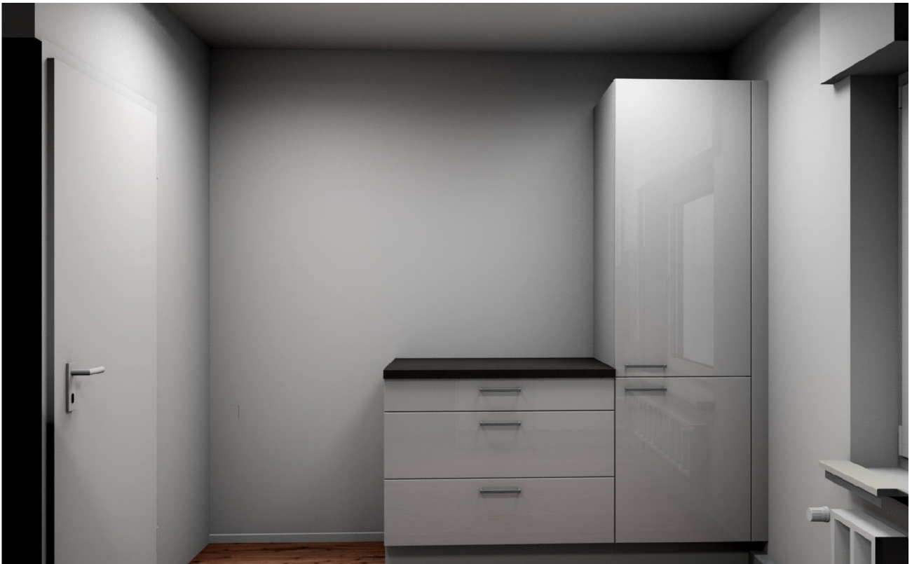
Finale Planung der Küche