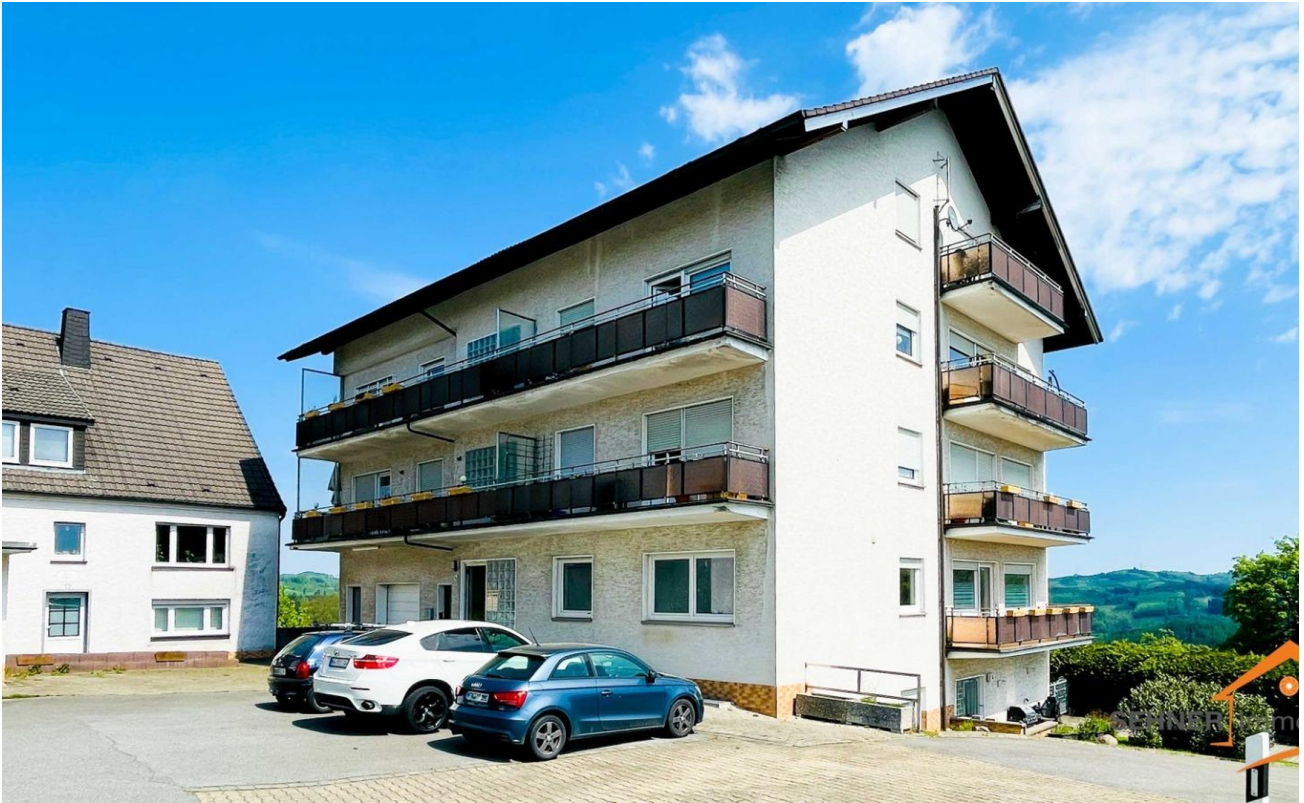
Fassade wird neu in 2026