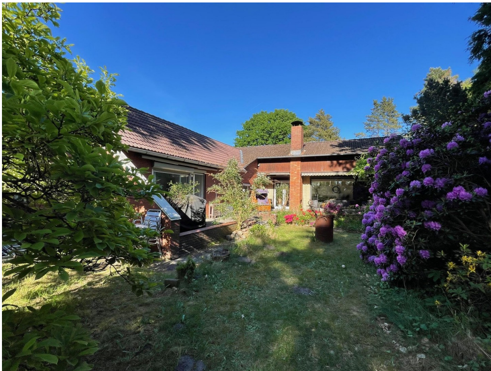
Blick aus dem Garten aufs Haus