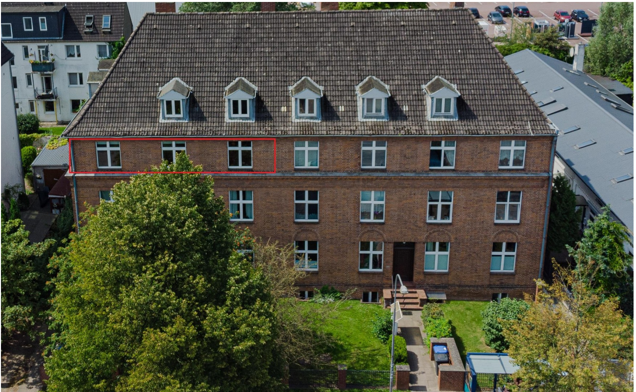
Frontansicht mit Markierung