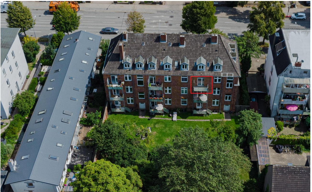
Rückansicht mit Markierung