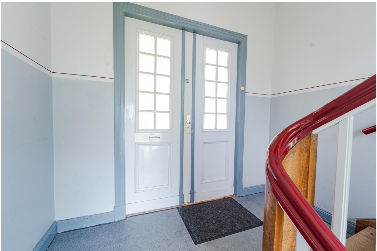
Wohnungseingang - Außen