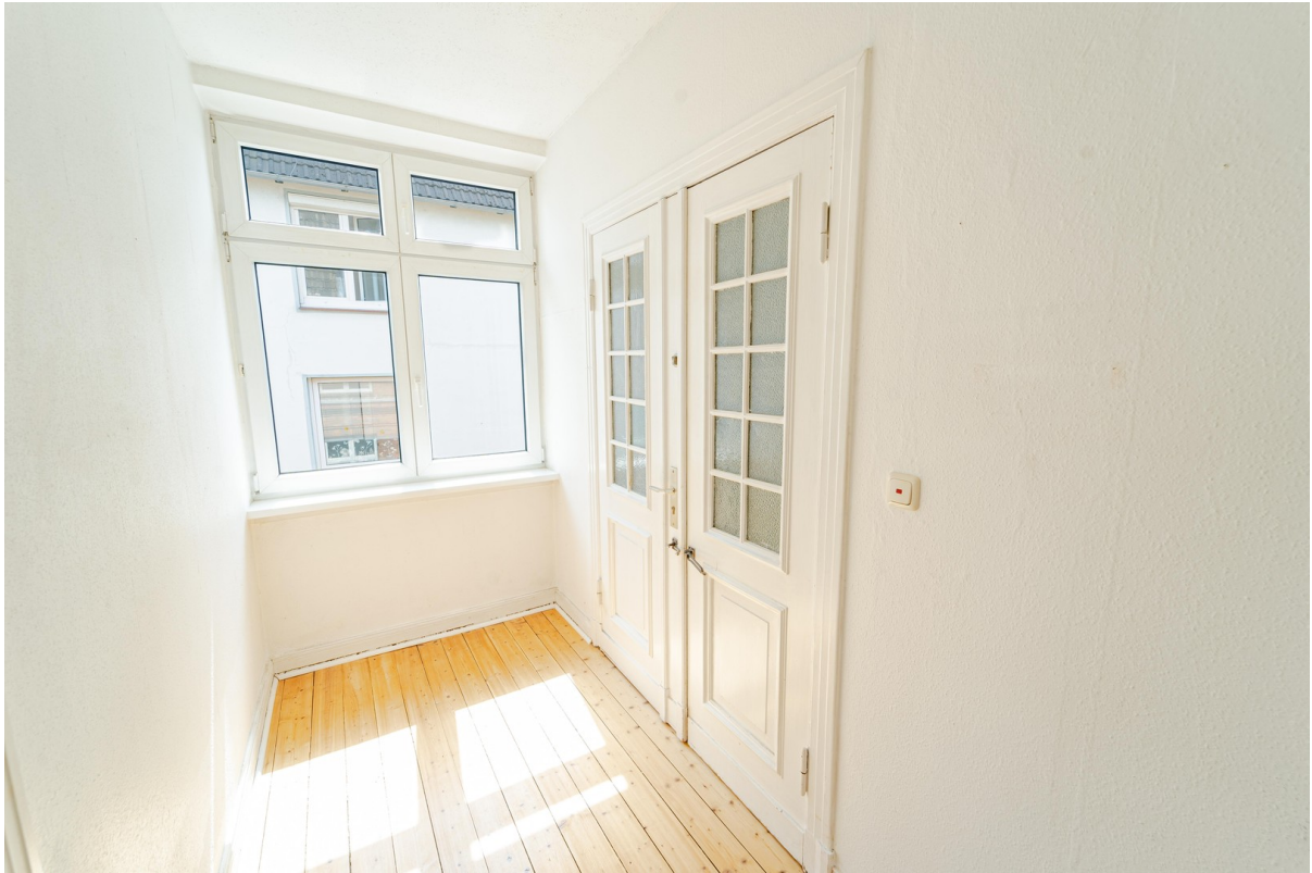
Wohnungseingang - Innen