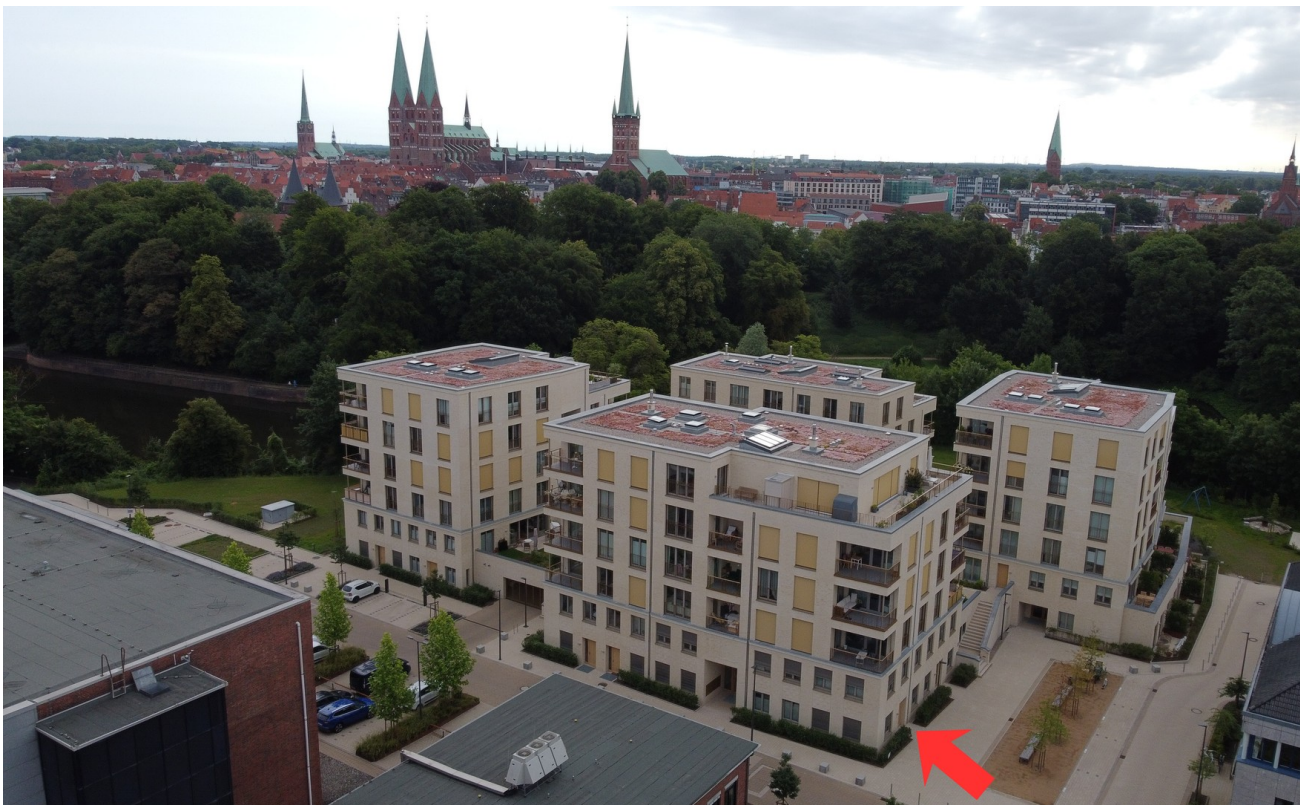
Standort Whg. K05 -Pfeil rot