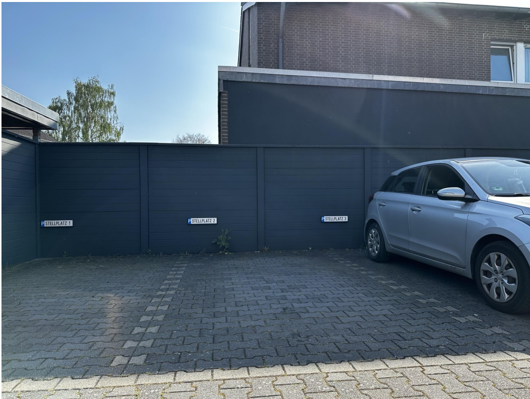
Stellplatz № 2