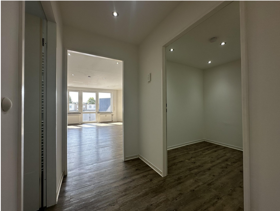
Diele / Flur