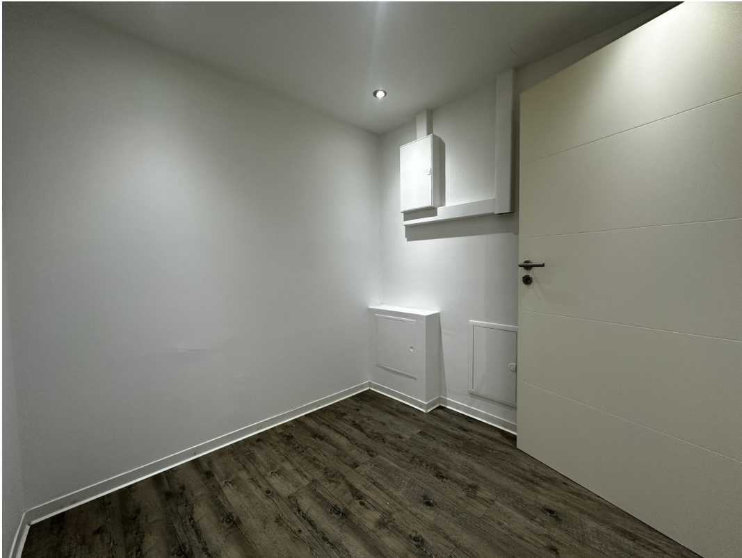
Ankleide / Abstellraum