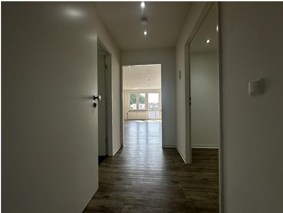
Diele / Flur