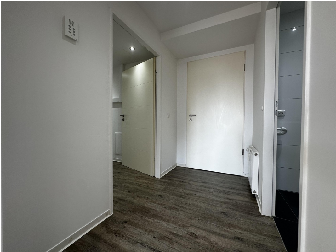
Diele / Flur