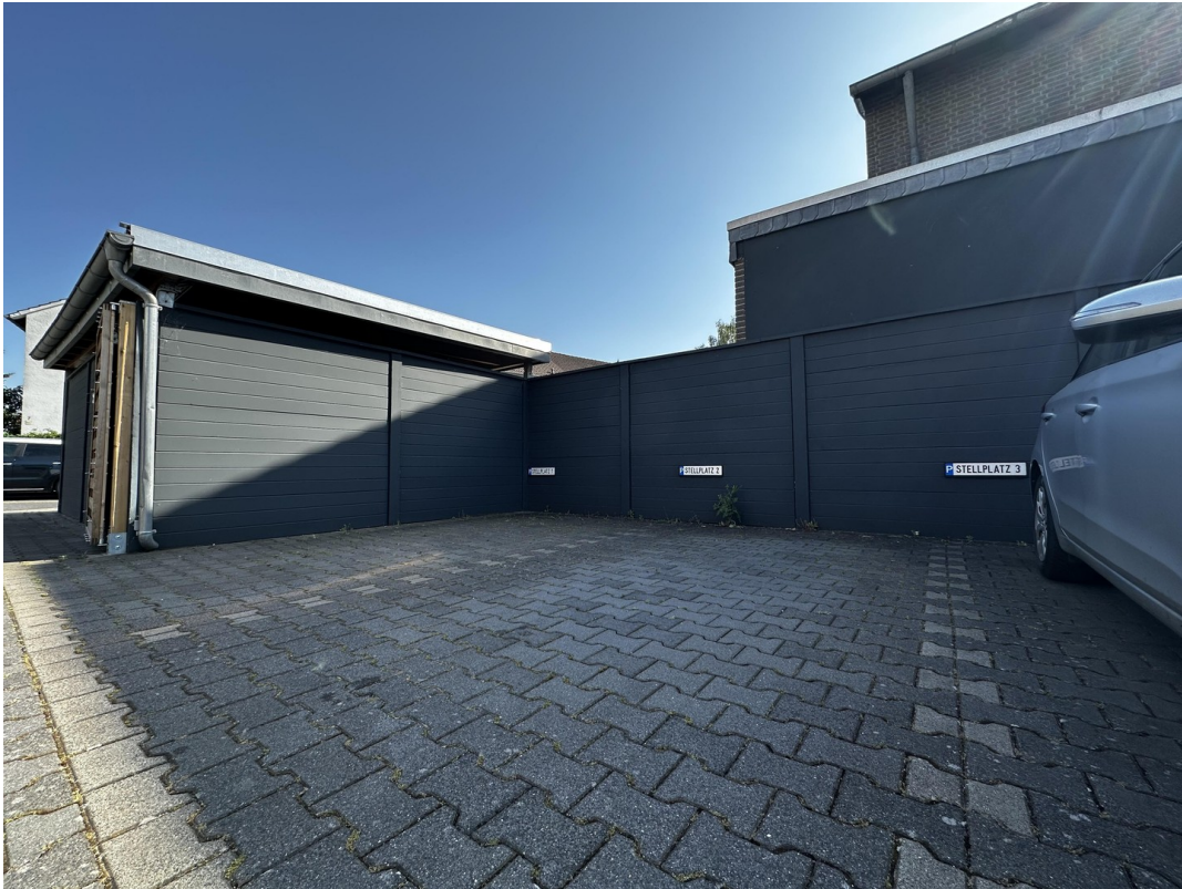
Stellplatz № 2