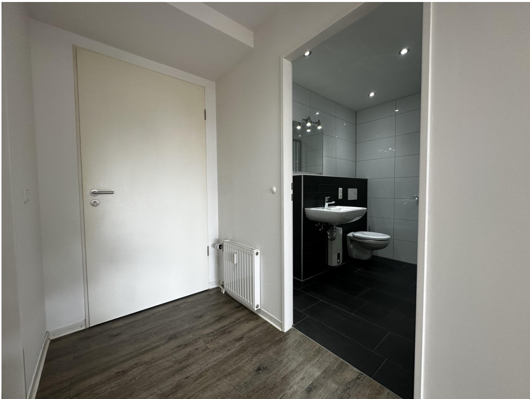
Diele / Flur