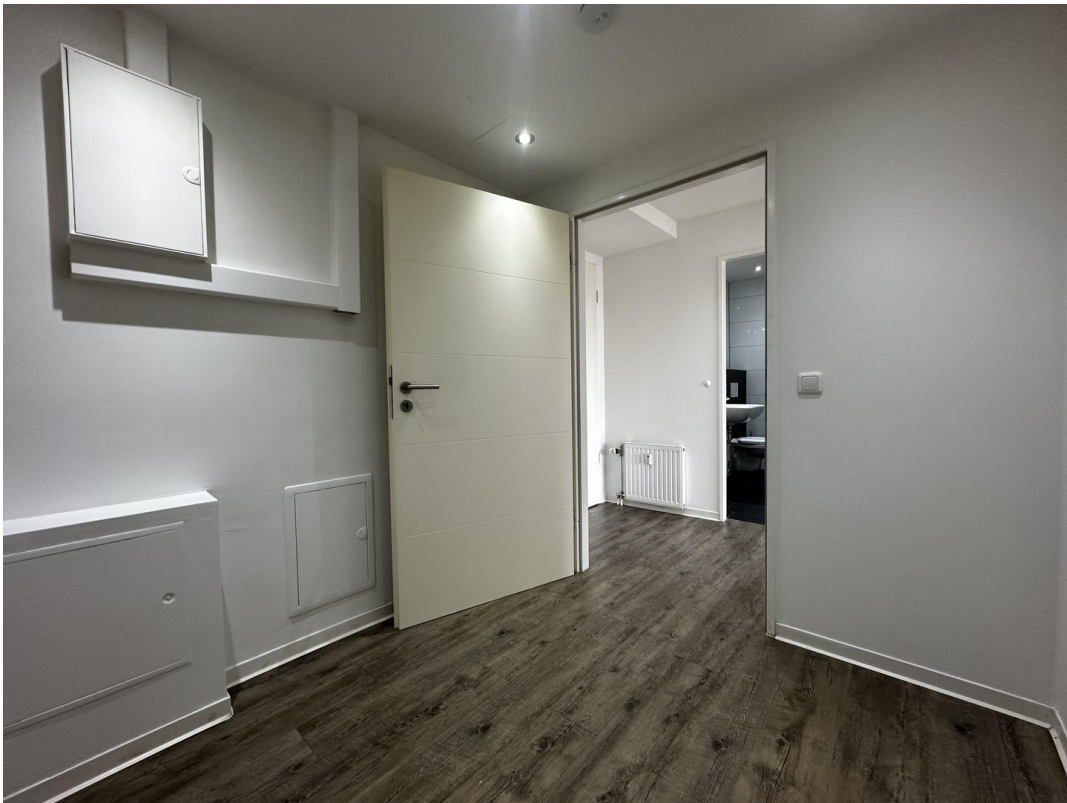
Ankleide / Abstellraum