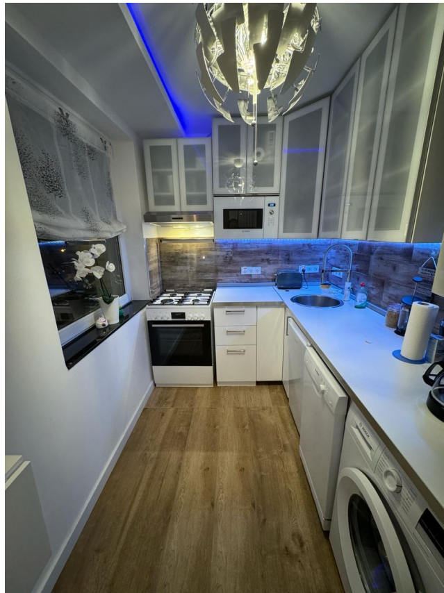
Küche am Abend