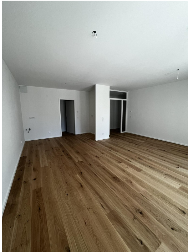
Wohnzimmer & Küche