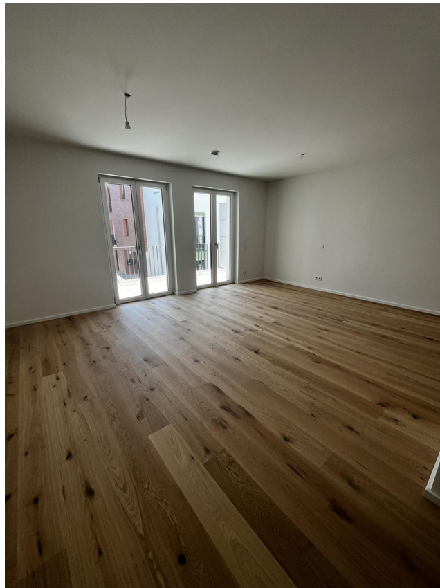
Wohnzimmer mit Ausblick Balkon