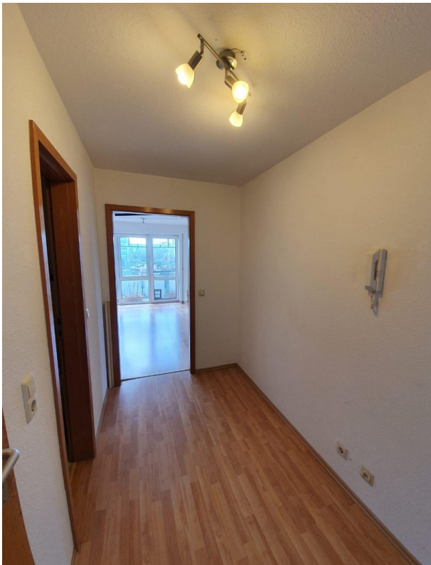
Flur mit Blick ins Wohnzimmer