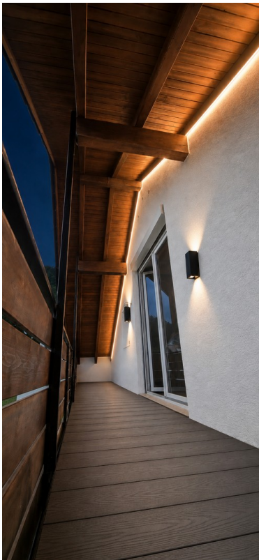
Außenbereich / Balkon (KI-b.)