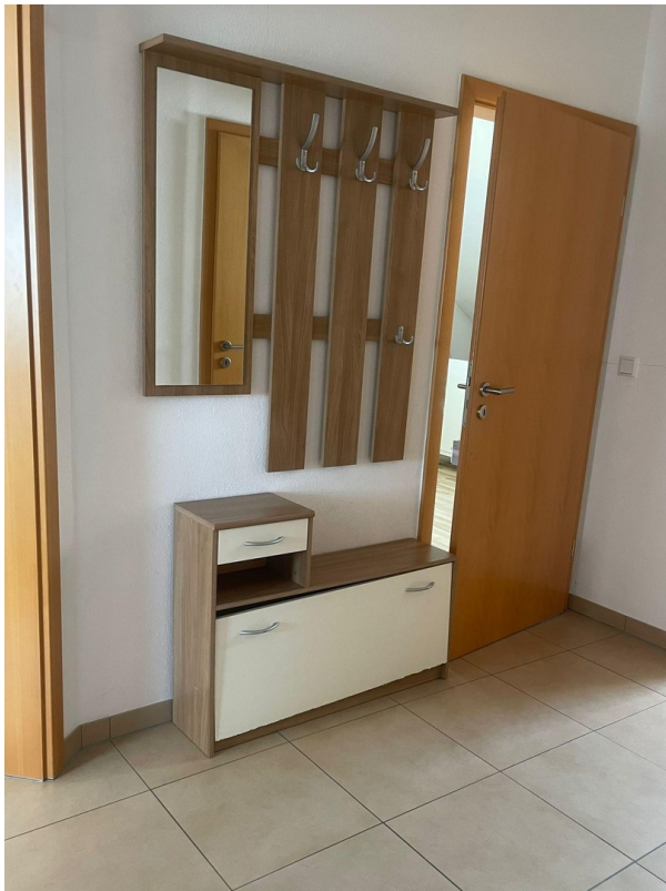
Flur mit Garderobe