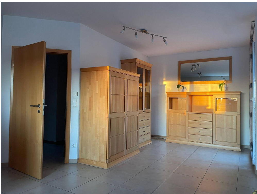
Wohnraum zur Dachterasse