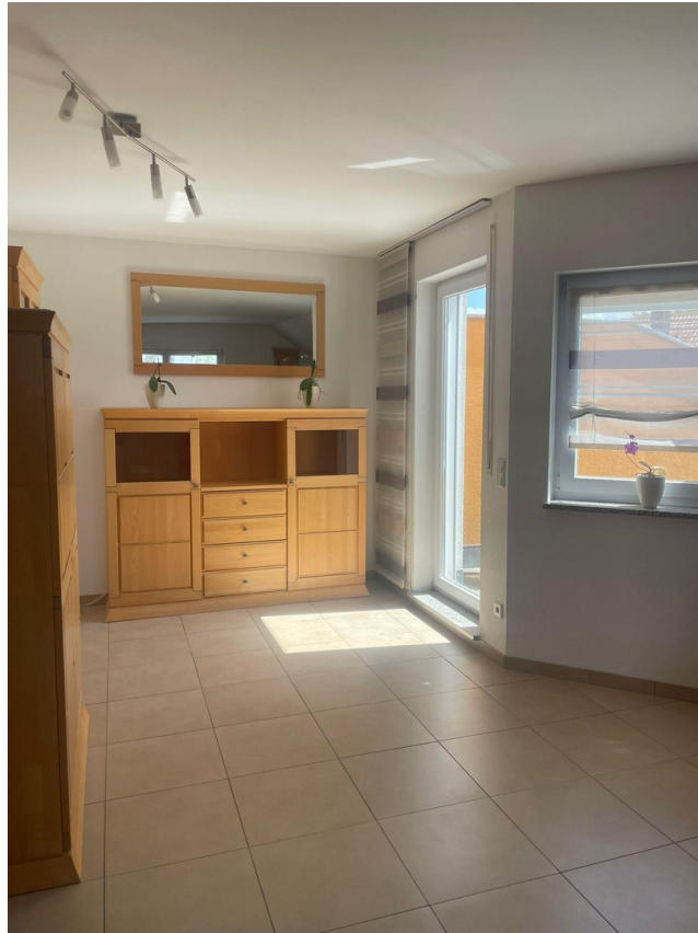
Wohnraum zur Dachterasse