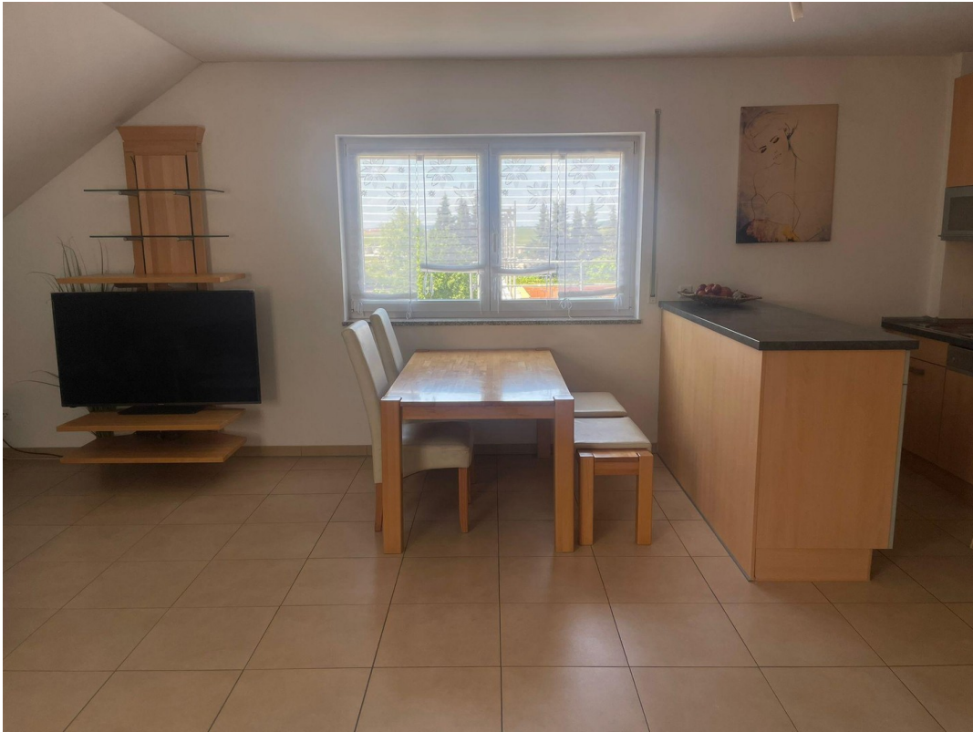
Wohnraum mit Küche