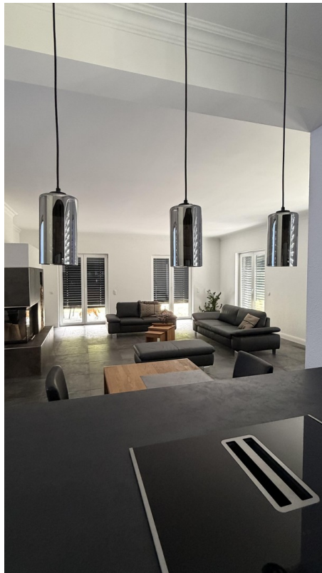
Kücheninsel Blick Wohnbereich