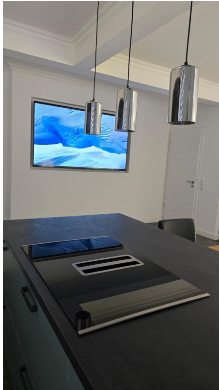
Kücheninsel Blick TV