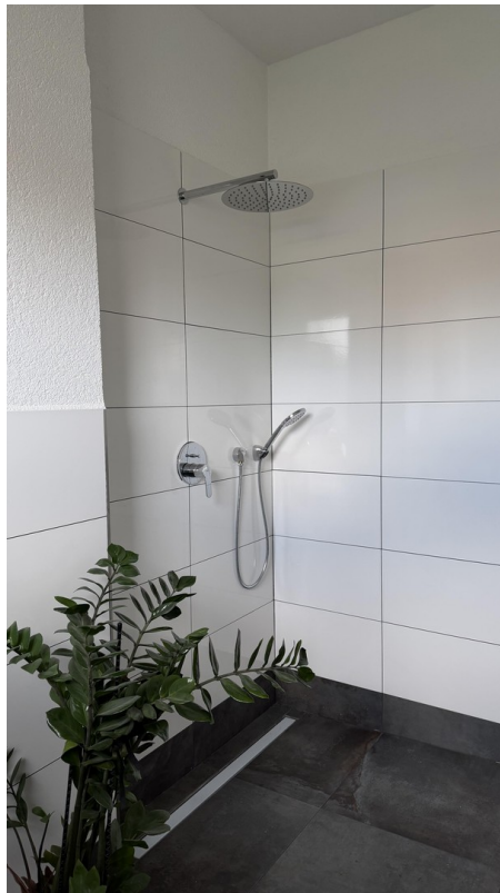
Gäste WC Dusche