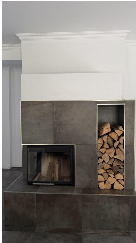
Kamin im Wohnbereich