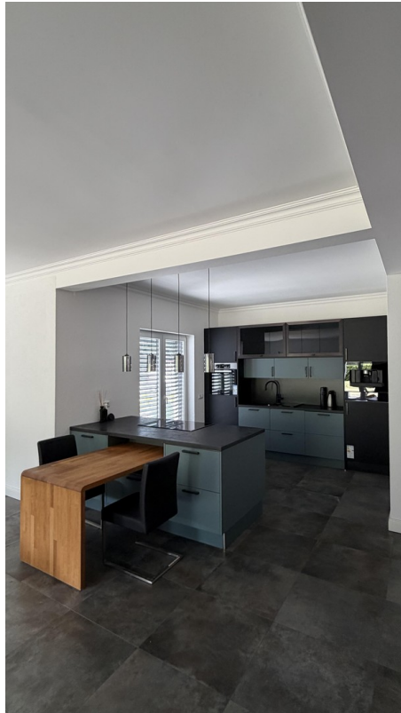
Offene Küche mit Kücheninsel