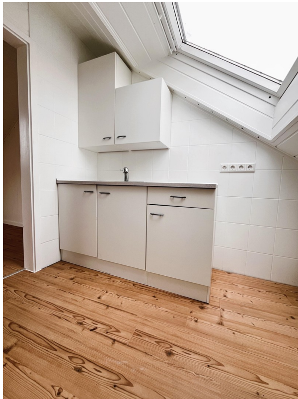
Küche linke Seite