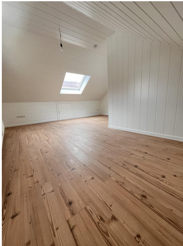
Wohnraum hinterer Teil