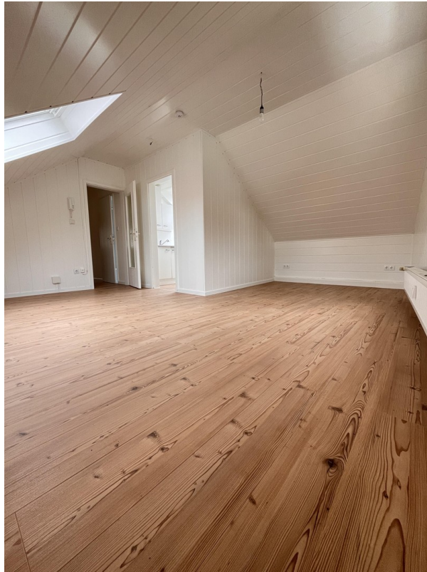
Wohnraum von hinten