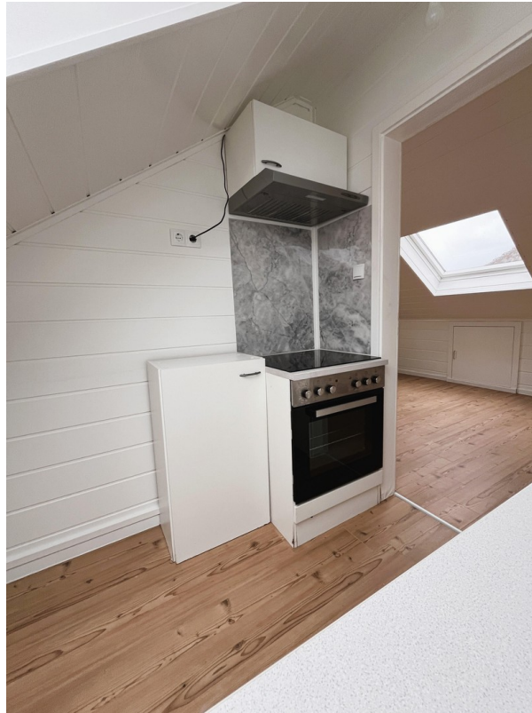
Küche rechts mit Ofen