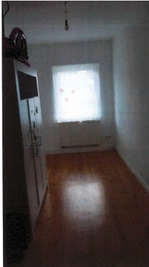
Kinderzimmer (altes Foto)