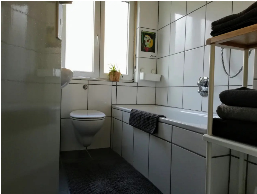
Badezimmer mit Duschwanne