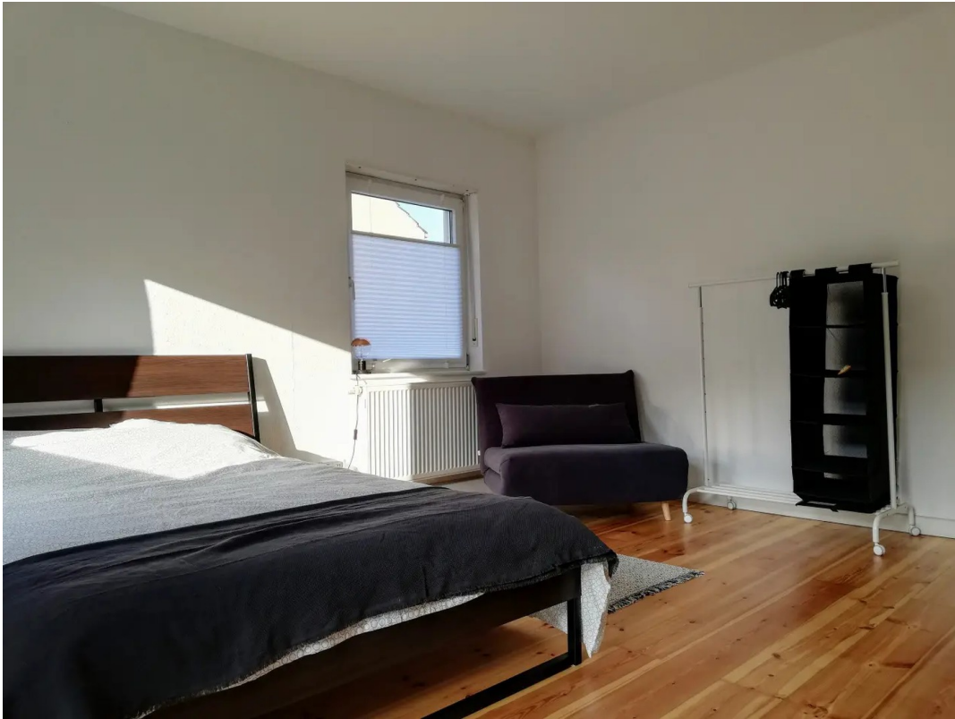
Schlafz. 1 (+Zugang Terrasse)