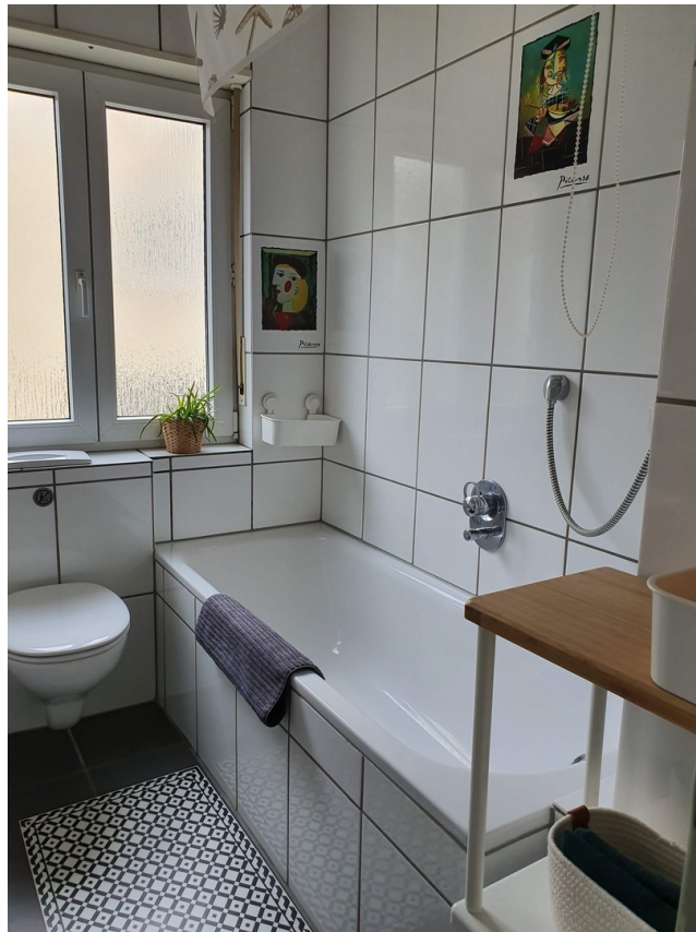
Badezimmer mit Duschwanne