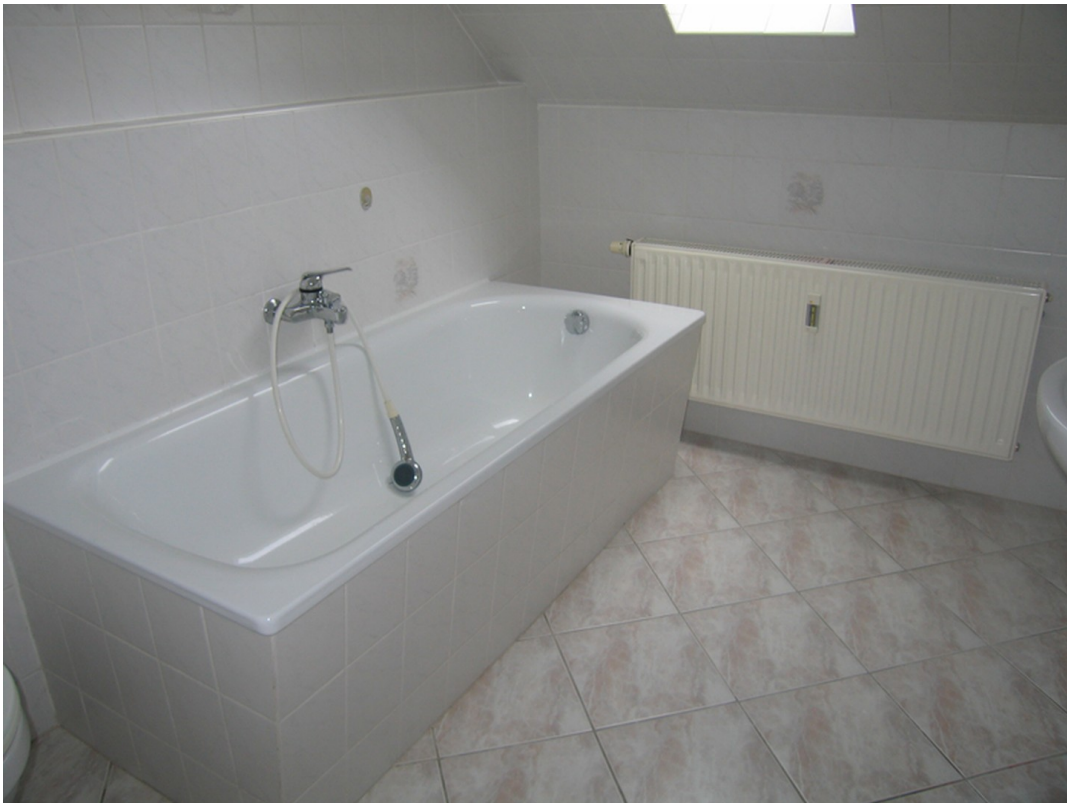
Beispiel 2. EG Singel WE