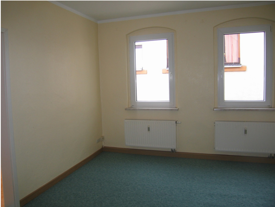
1. OG Wohnzimmer