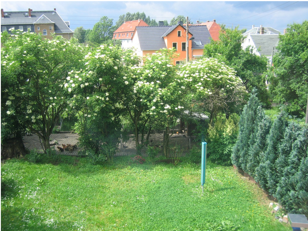
Hof schön ruhig Sitz und Grill