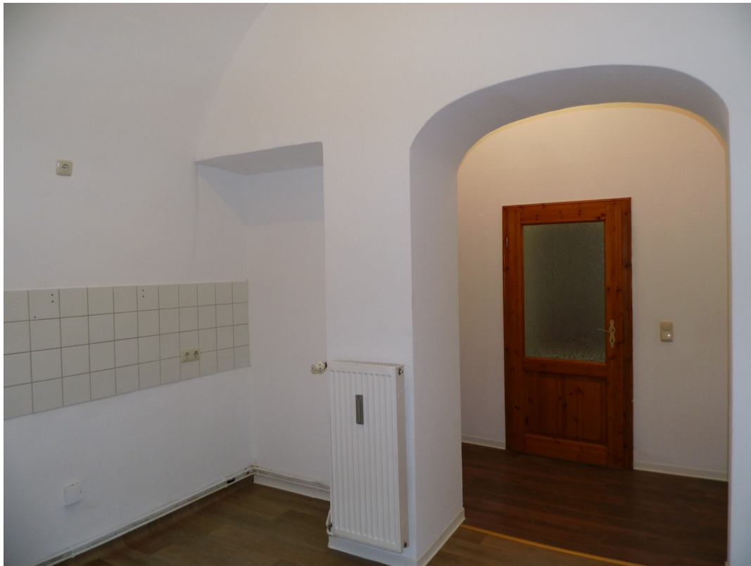
Küche und Vorratsraum