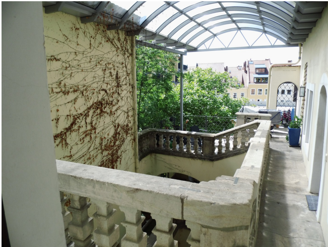
Blick auf Terrasse