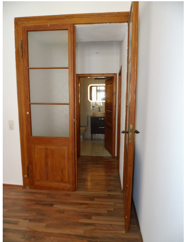
Blick vom Schlafzimmer in Bad