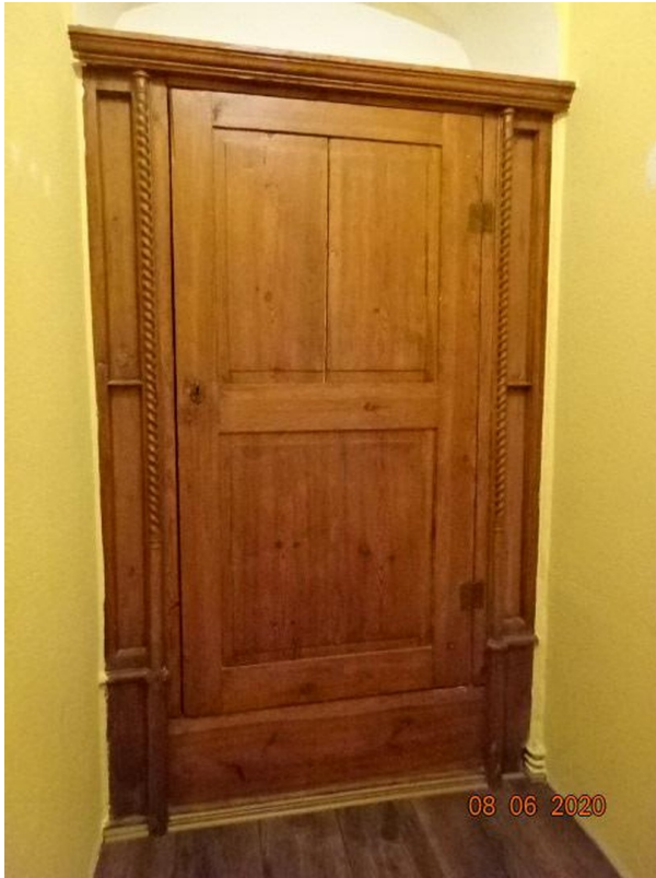
Einbauschränk im Vorratsraum