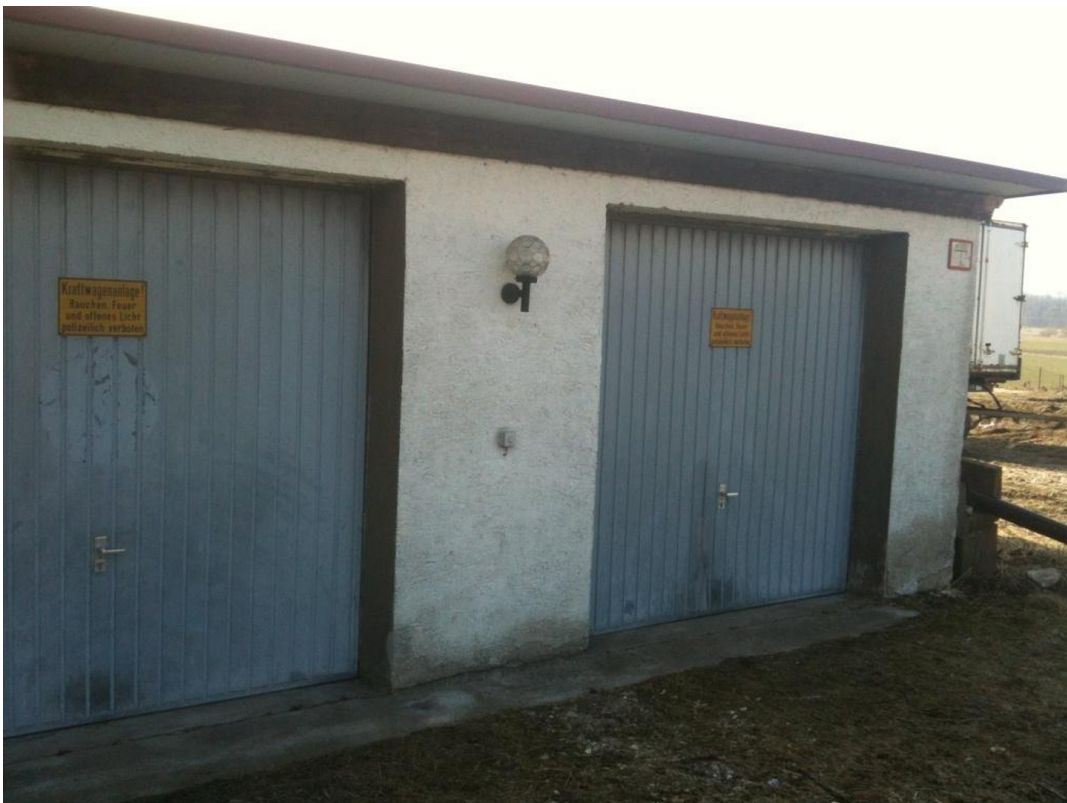
Doppelgarage mit Arbeitsgrube