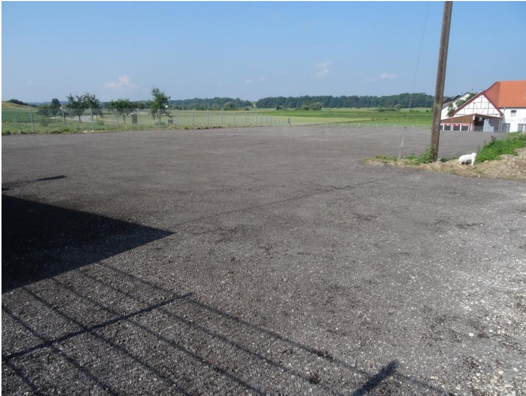
Blick Richtung Südwest