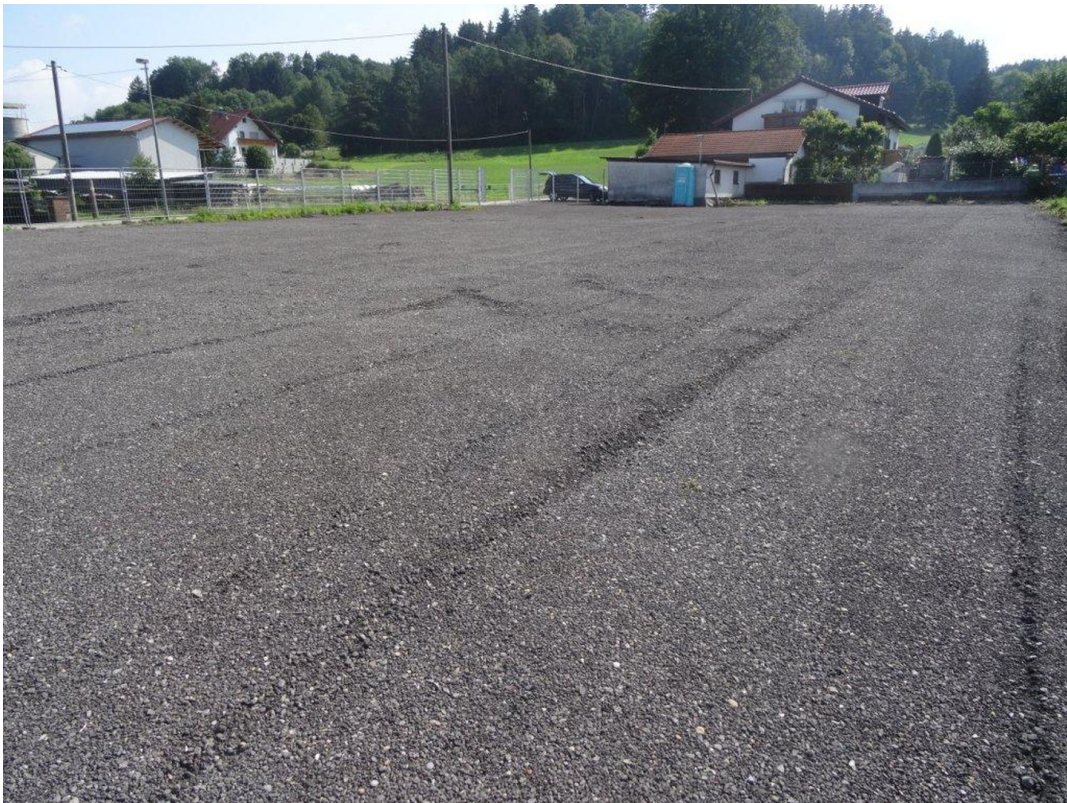
Blickrichtung Nord Ost