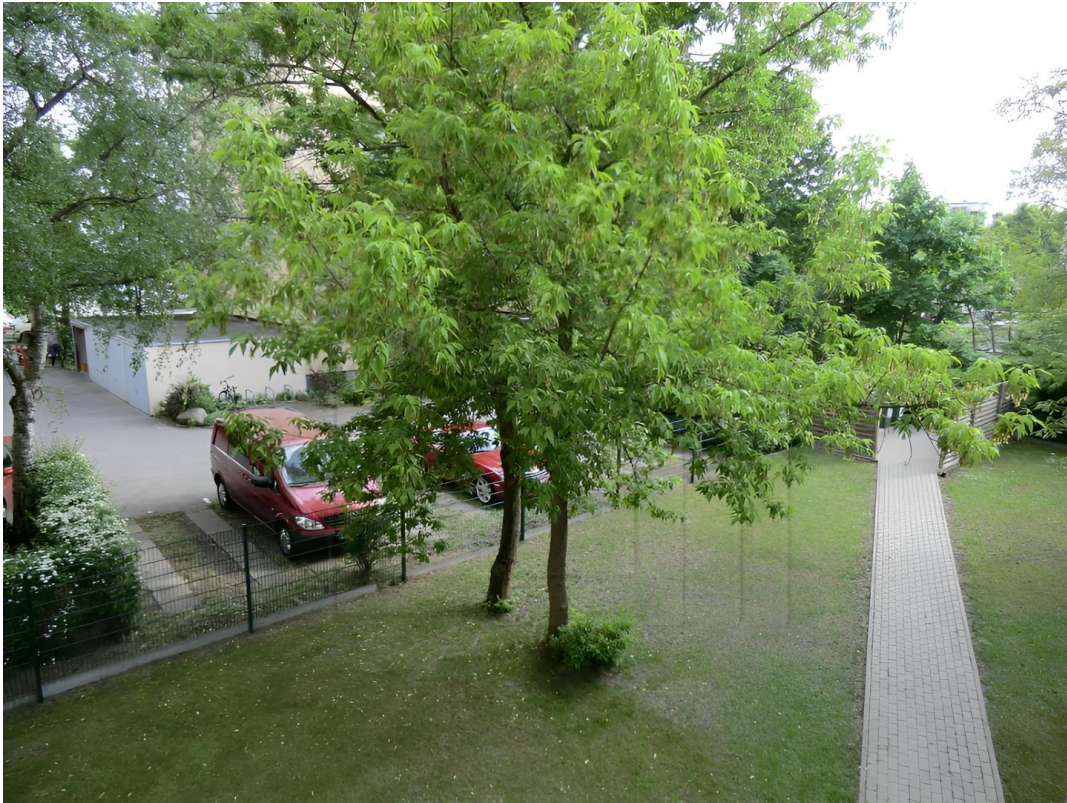
Garten im Innenhof