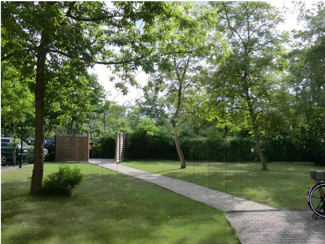
Garten im Innenhof