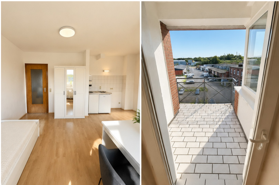
Balkon / Wohnraum