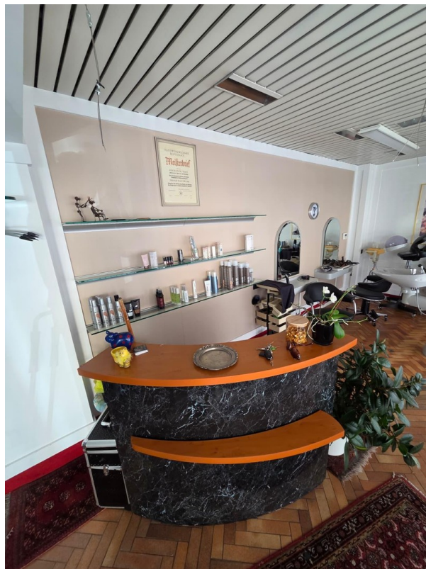
Hauptraum / Theke