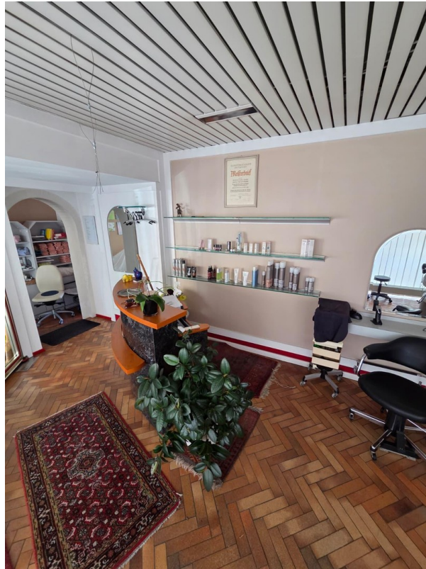
Hauptraum / Theke