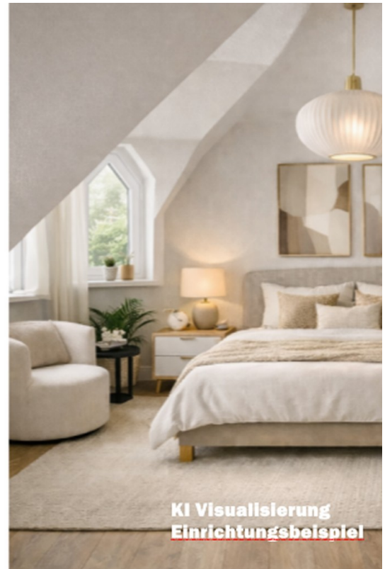
Schlafzimmer unter dem Dach