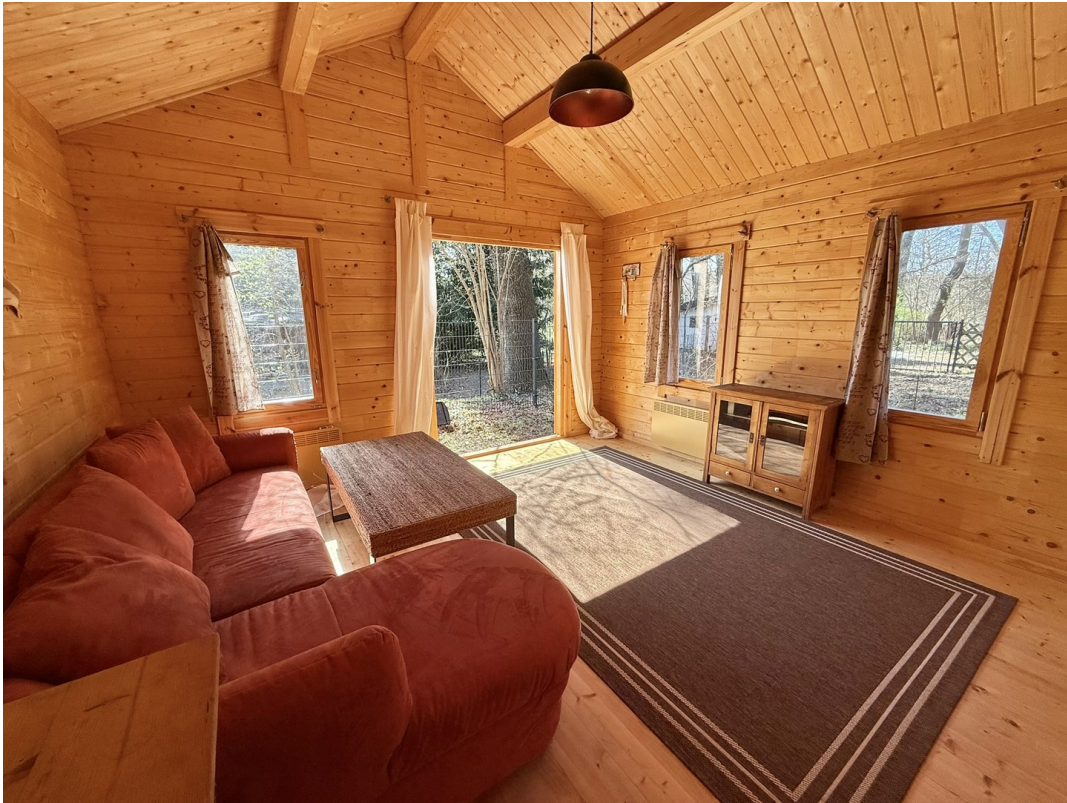
Blockhaus 2 - Wohnzimmer