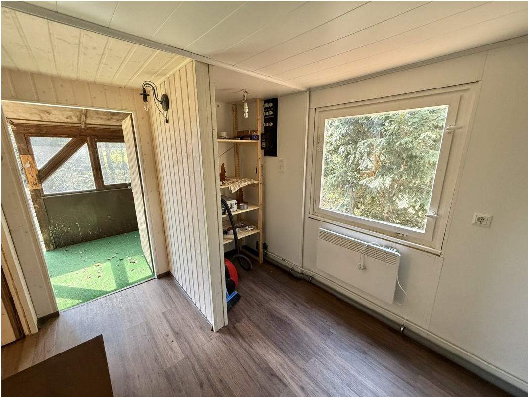
Blockhaus 1 - Abstellnische