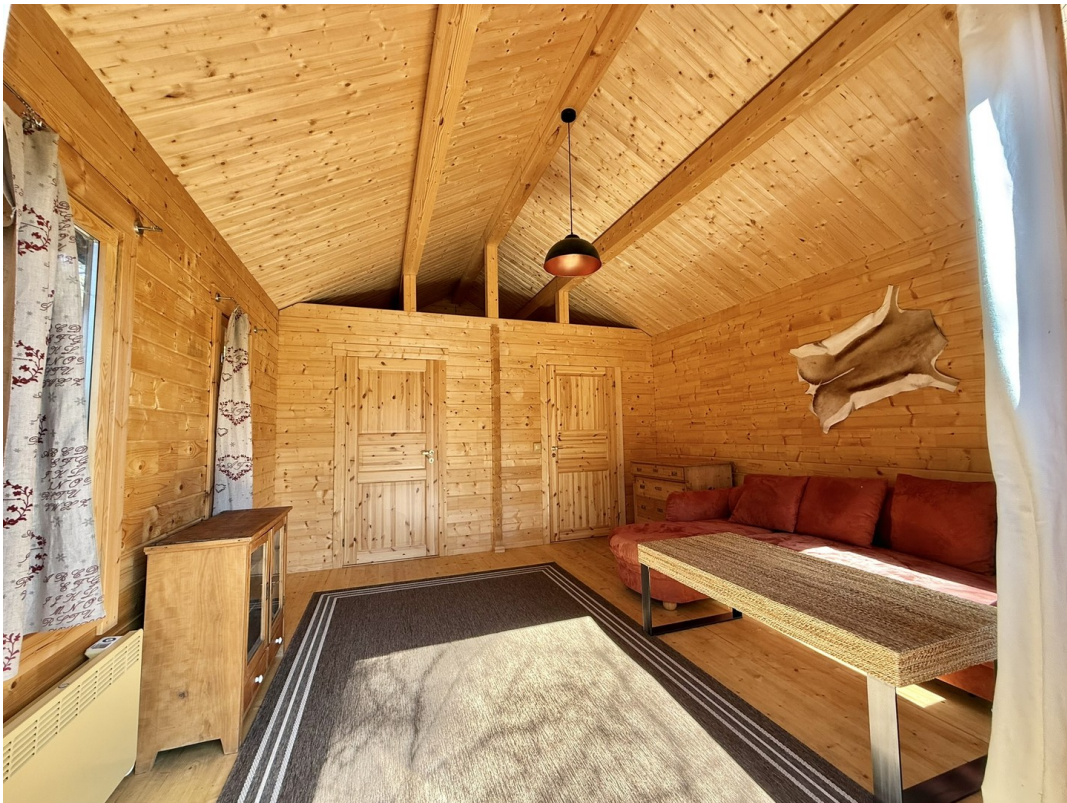
Blockhaus 2 - Wohnzimmer