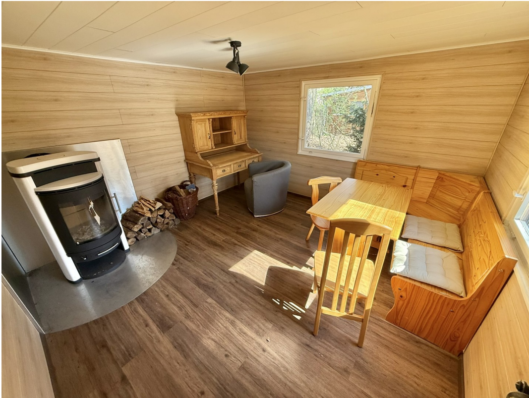
Blockhaus 1 - Wohnzimmer