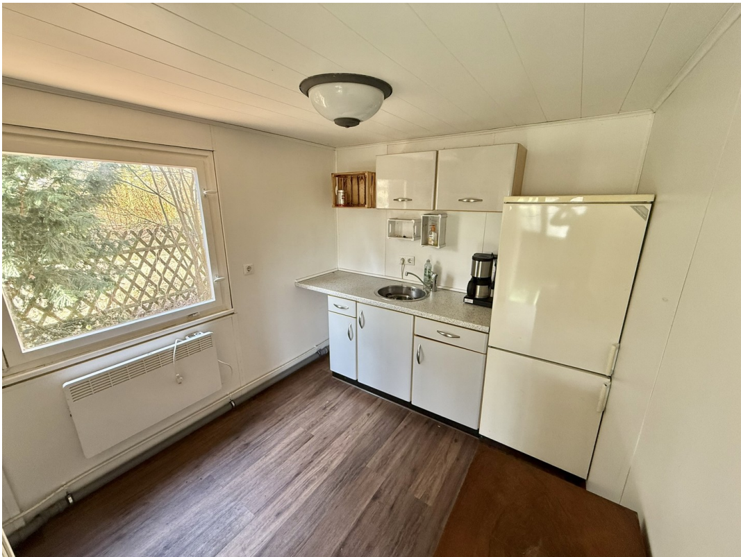
Blockhaus 1 - Küche