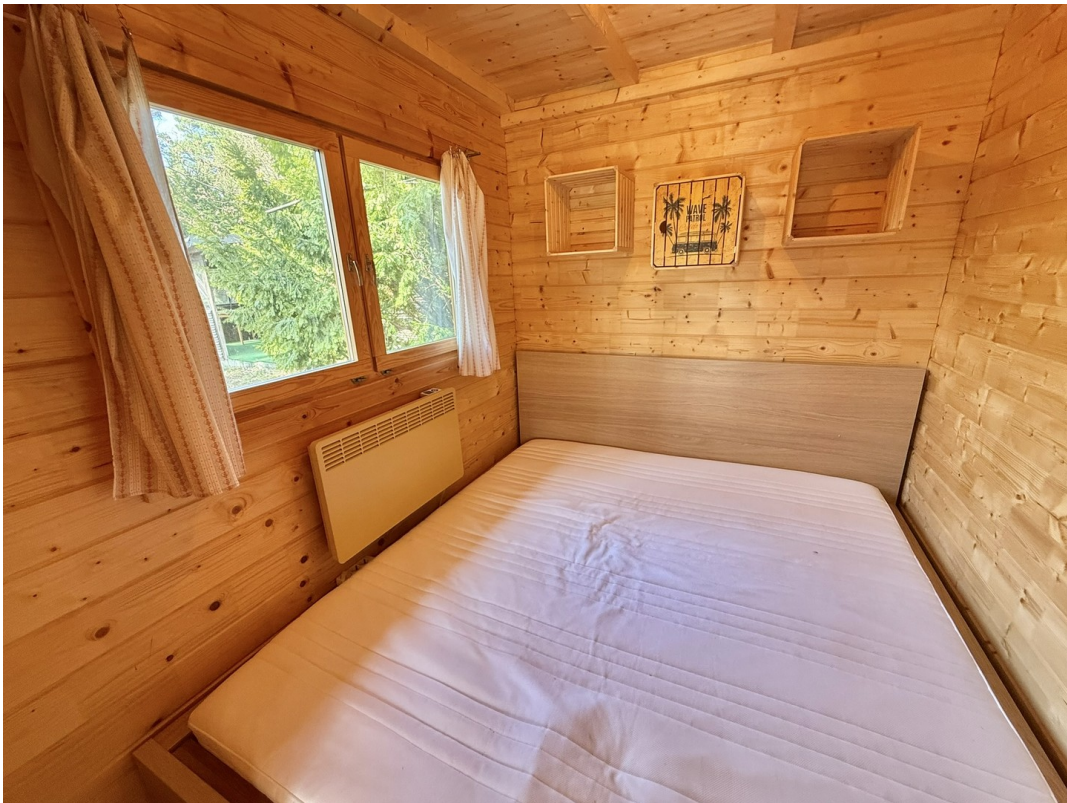
Blockhaus 2 - Schlafzimmer