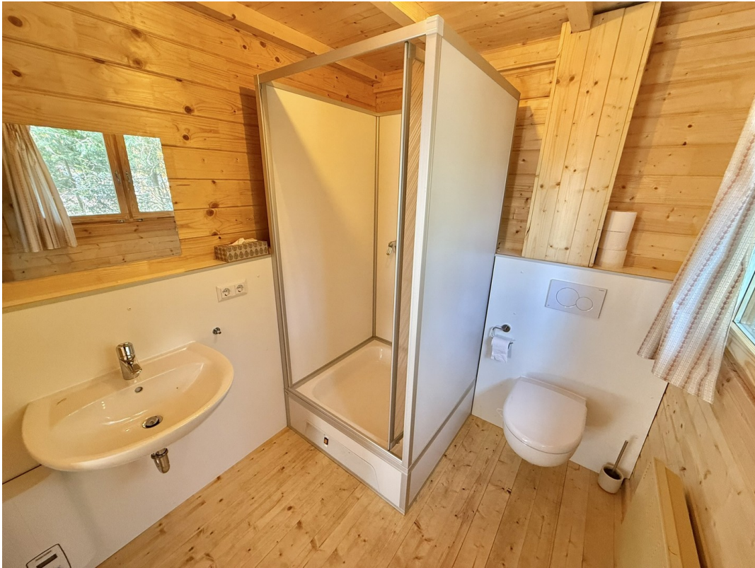
Blockhaus 2 - Bad