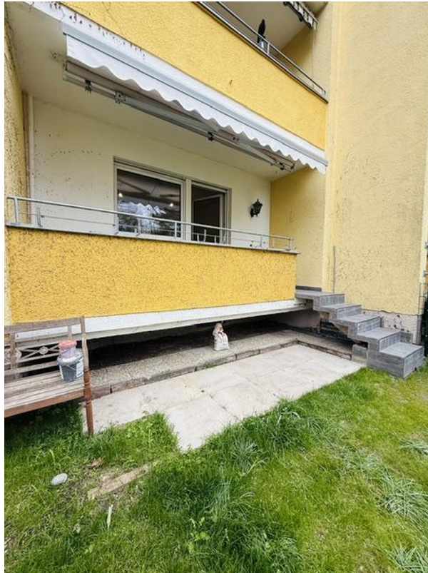
Balkon mit Terrasse