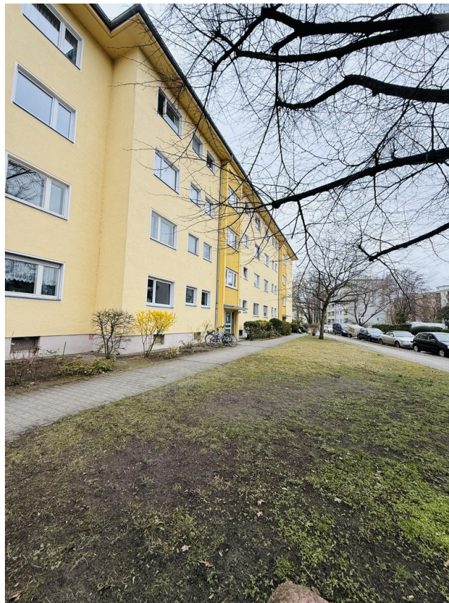
Fassadenansicht des Hauses