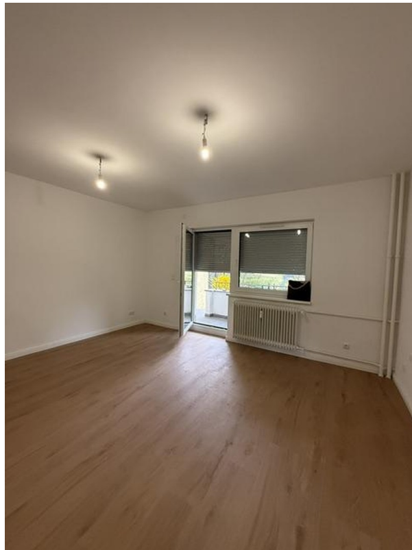
Wohnzimmer + Rollos