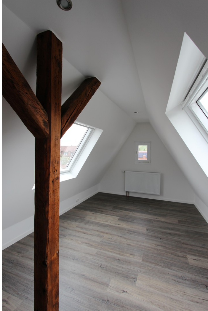
sep. Zimmer / Hobbyraum