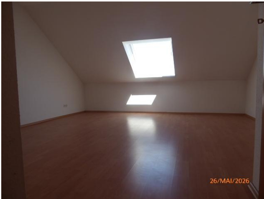
Schlafzimmer 2. OG