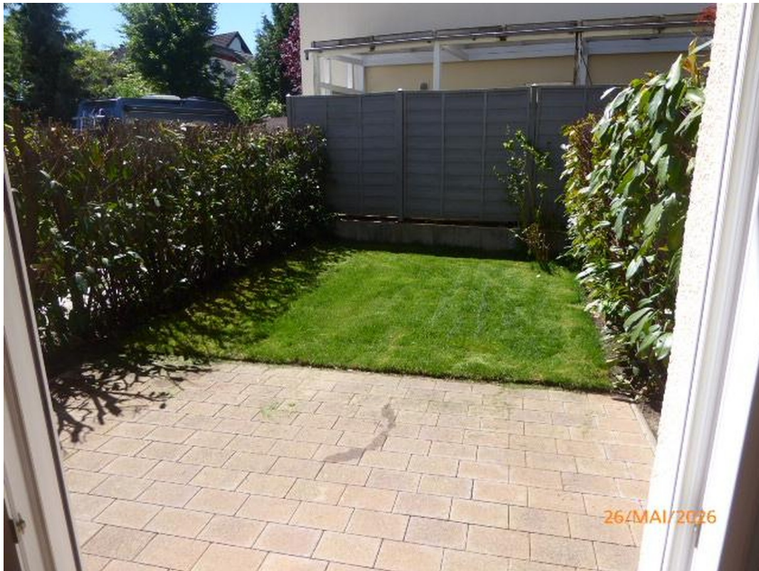
vom Wohn/Essbereich Blick in d