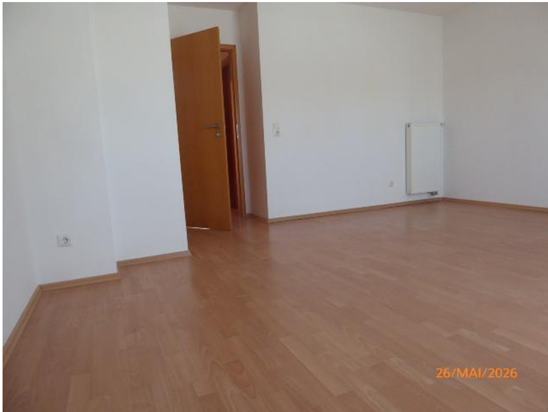
Schlafzimmer 2. OG