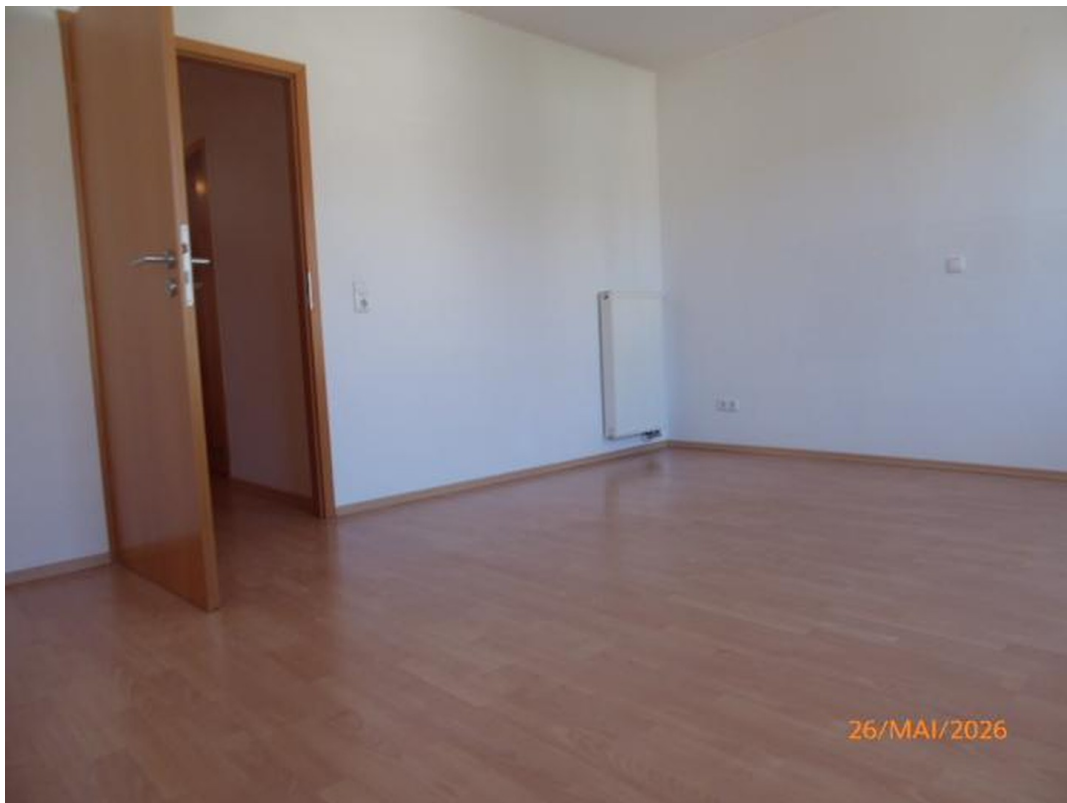
Schlafzimmer 1 / 1.OG