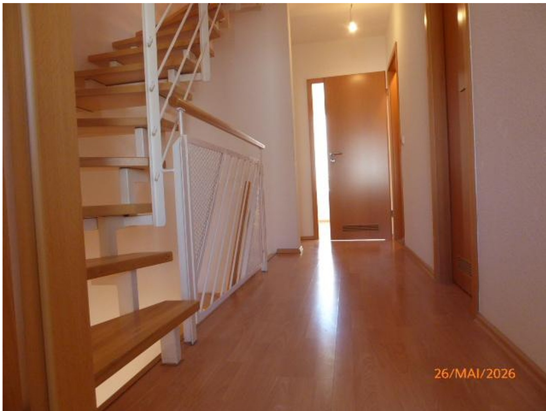
Flur 1. OG