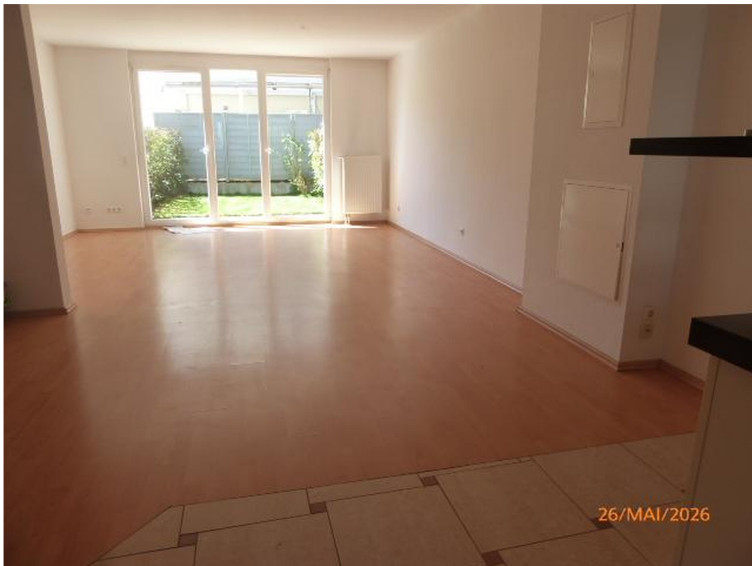
Blick von der Küche zum Garten