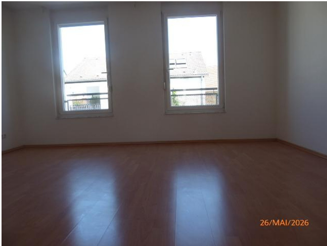
Schlafzimmer 2 / 1. OG