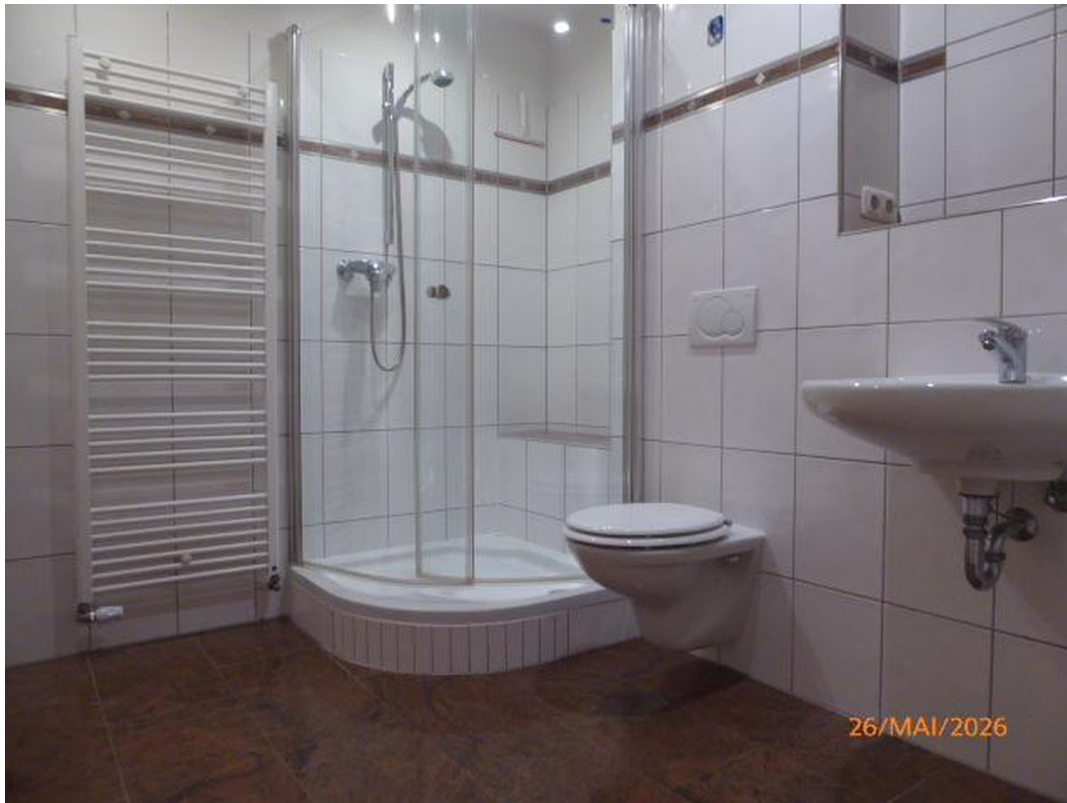
Bad 2. OG