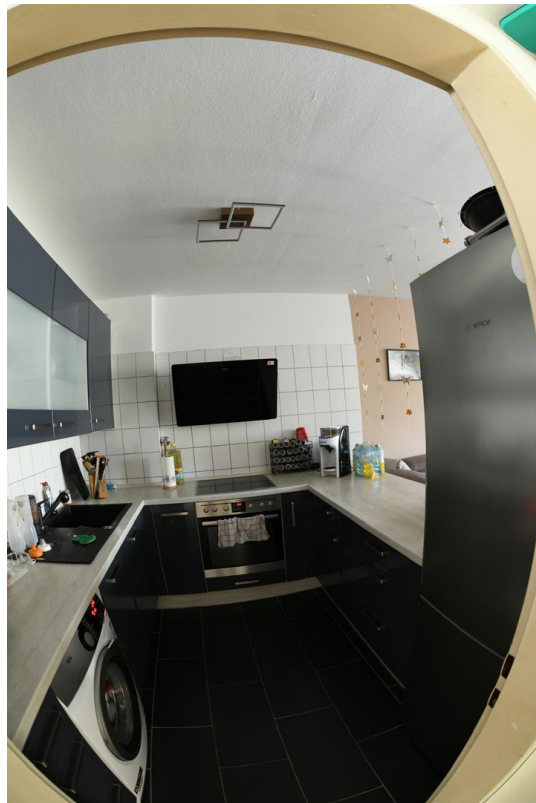
Küche offen zu WZ