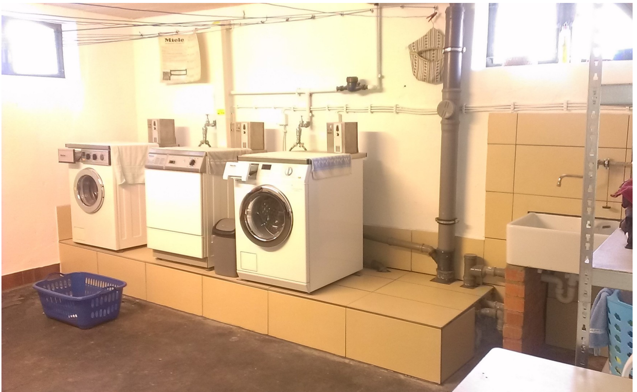
Haus-Waschmaschine im Keller