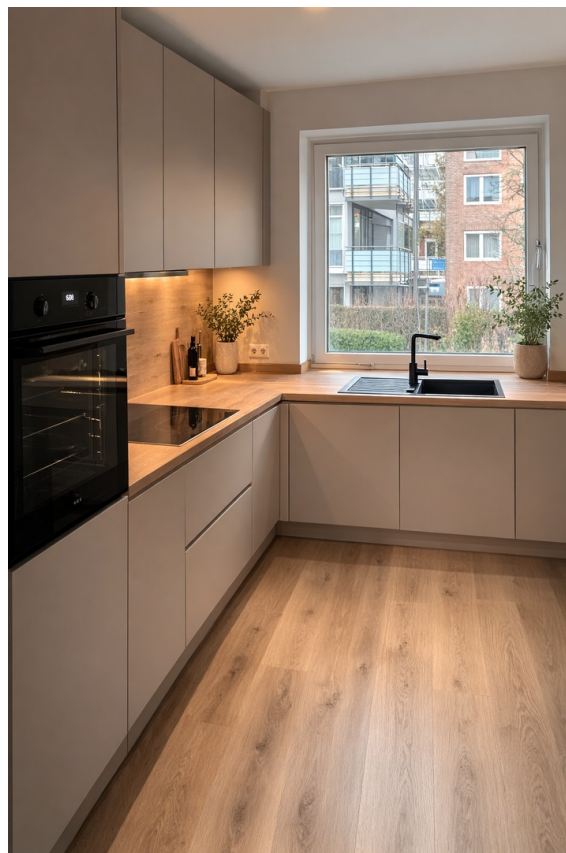
Küche, KI generiert