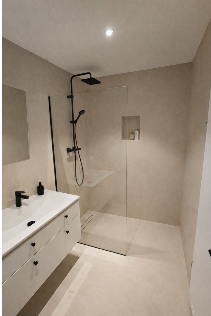
Bad, KI generiert