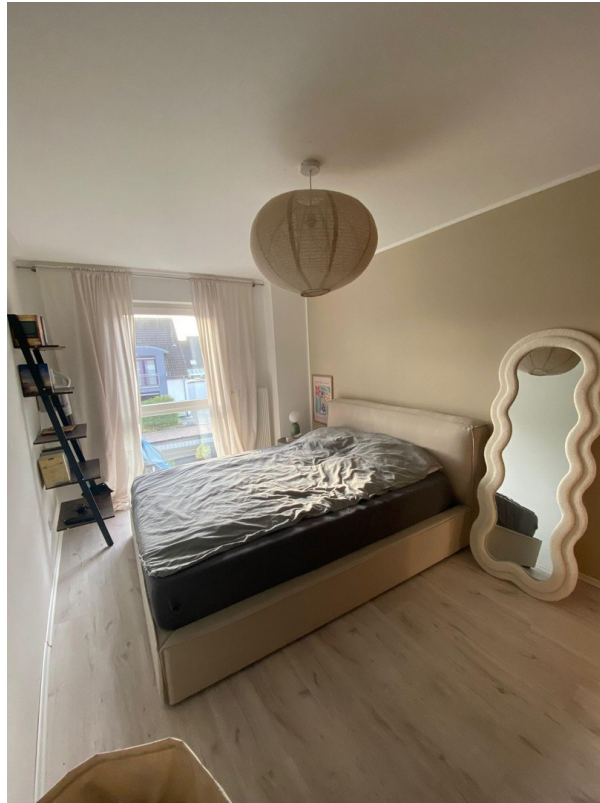
Schlafen (baugl. Wo.)