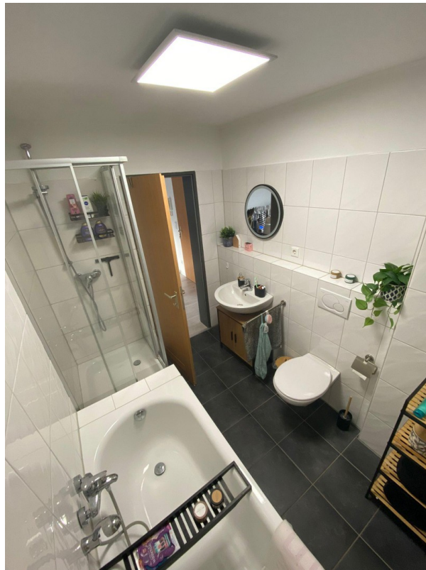
Bad (baugl. Wo.)