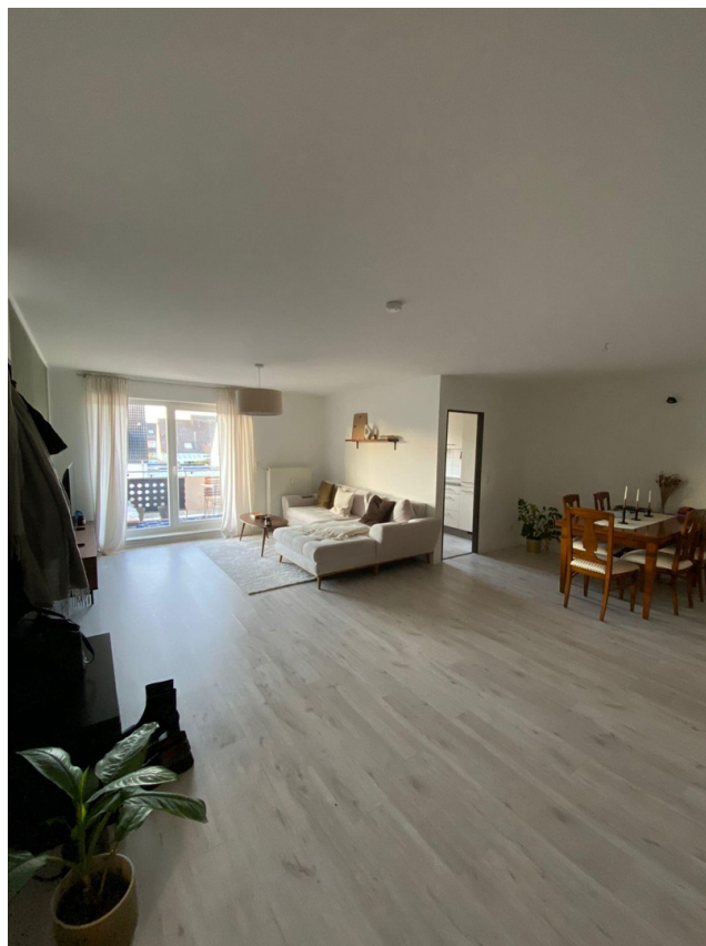
Wohnen/Essen (baugl. Wo.)