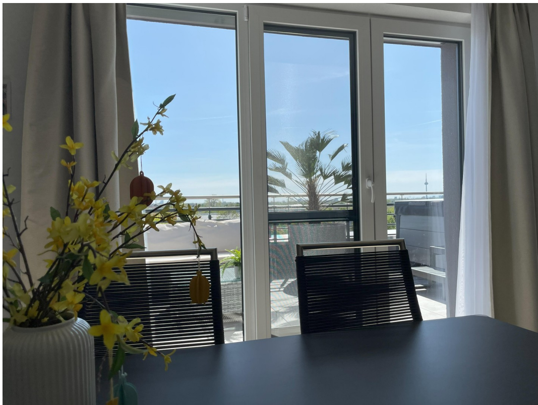
Essbereich mit Ausblick