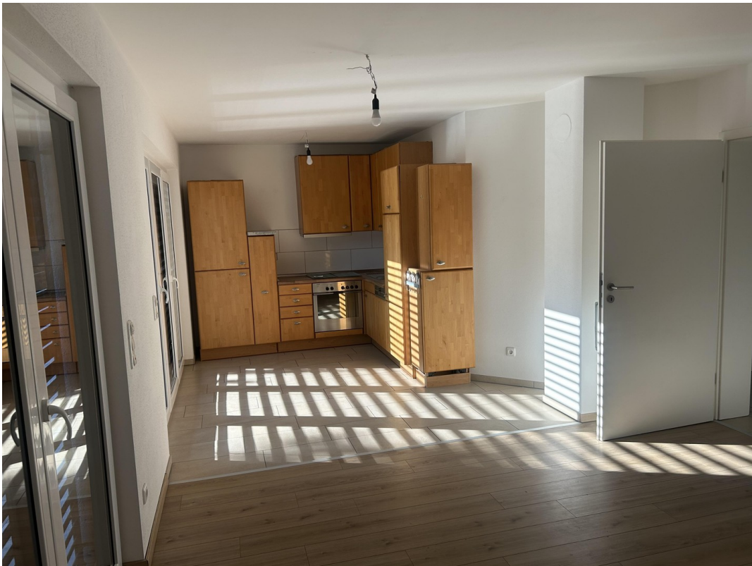
Küche Essen Wohnen