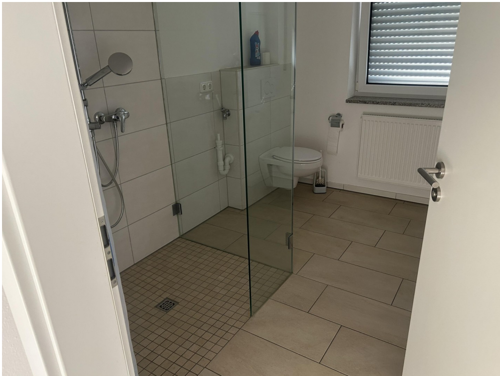
Bad begehbare dusche