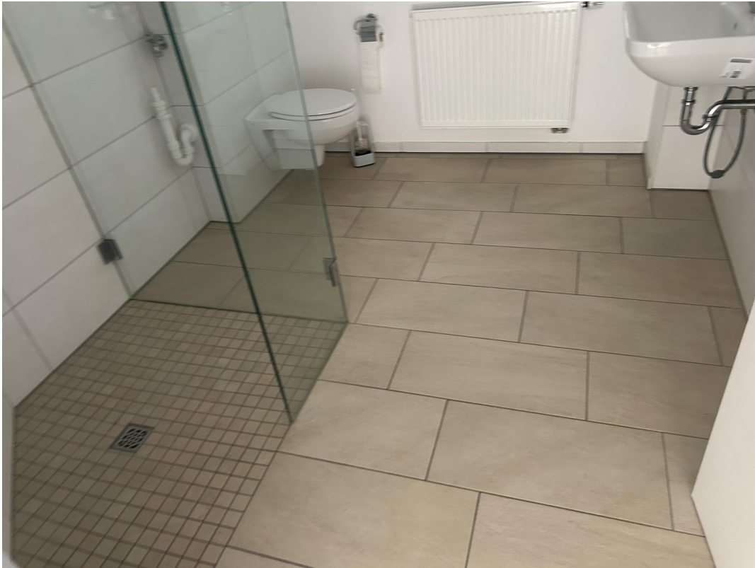
Bad gr Dusche