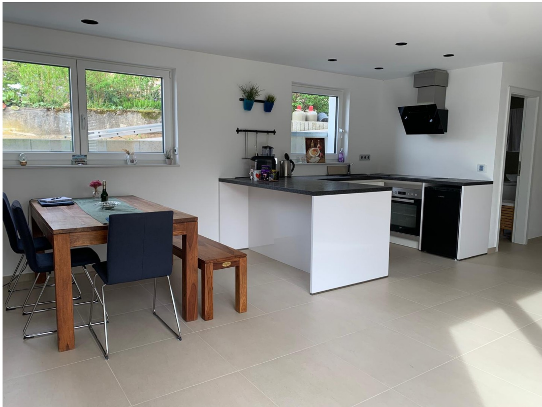
Essbereich mit Küche