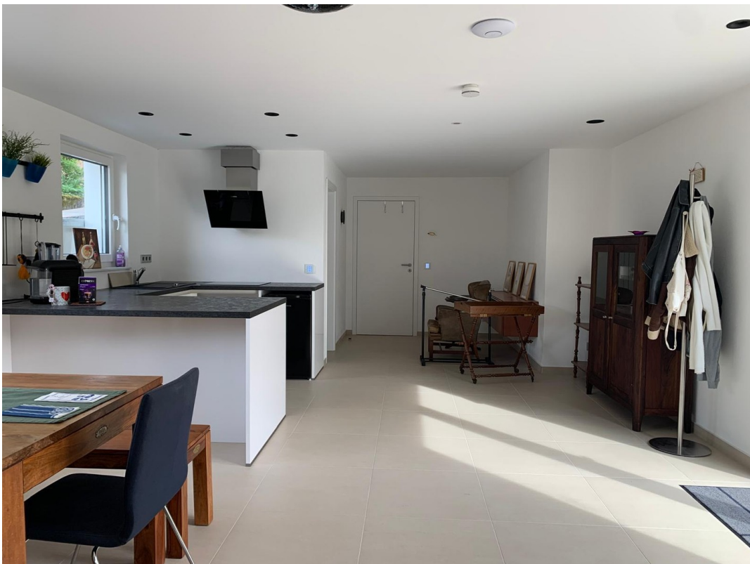
Küche und Eingangsbereich