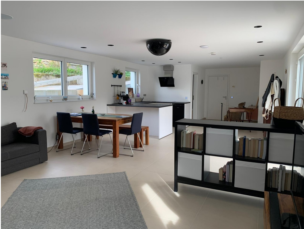
Essbereich mit Küche