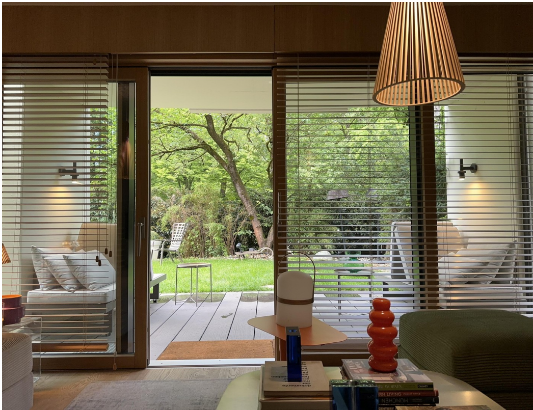
Blick aus Wohnzimmer in Garten