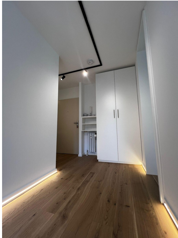
Eingang mit Möbeln