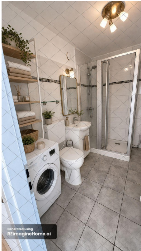
Bad mit Home Staging