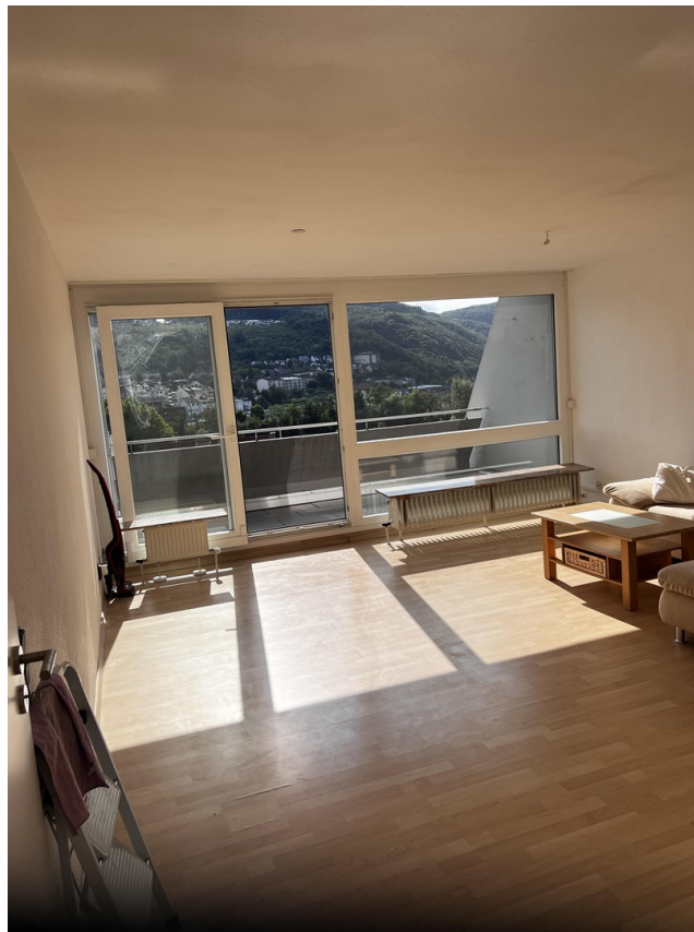
Wohnzimmer Blick raus