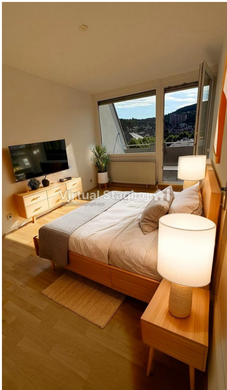
Schlafzimmer mit Home Staging