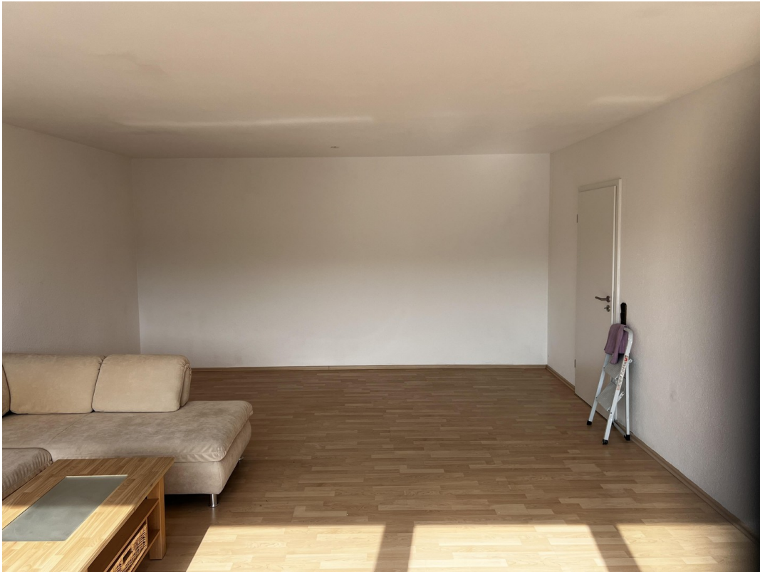
Wohnzimmer Blick rein