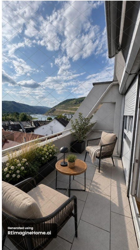
Balkon mit Home Staging