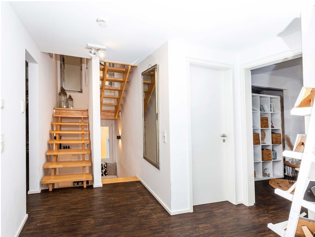
Aufgang oberes Stockwerk