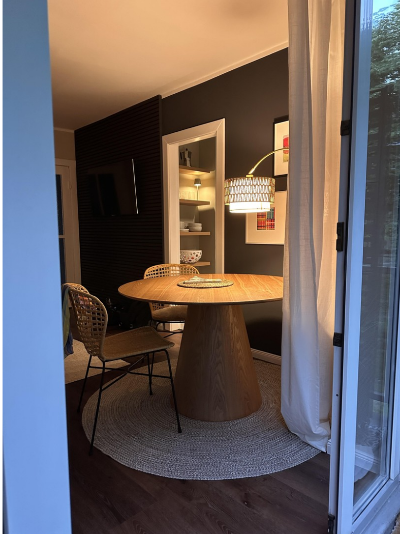
Für schöne Stunden