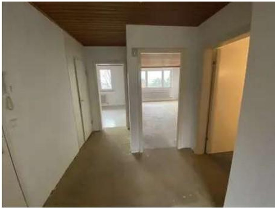
Blick von der Küche