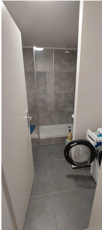
Bad mit Waschtrockner