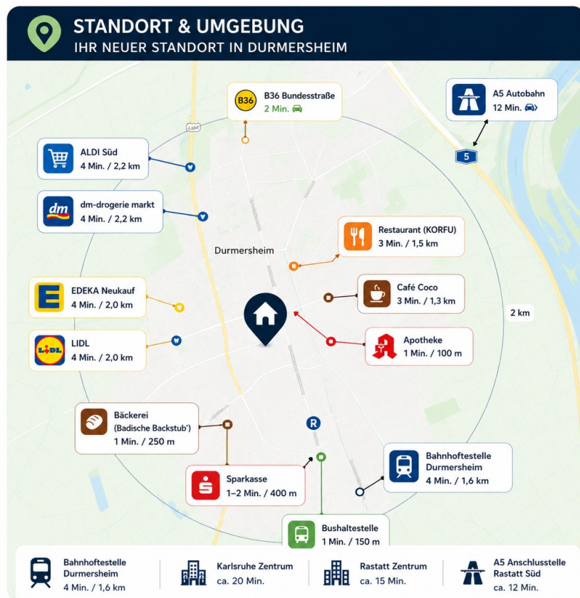
Standort & Umgebung