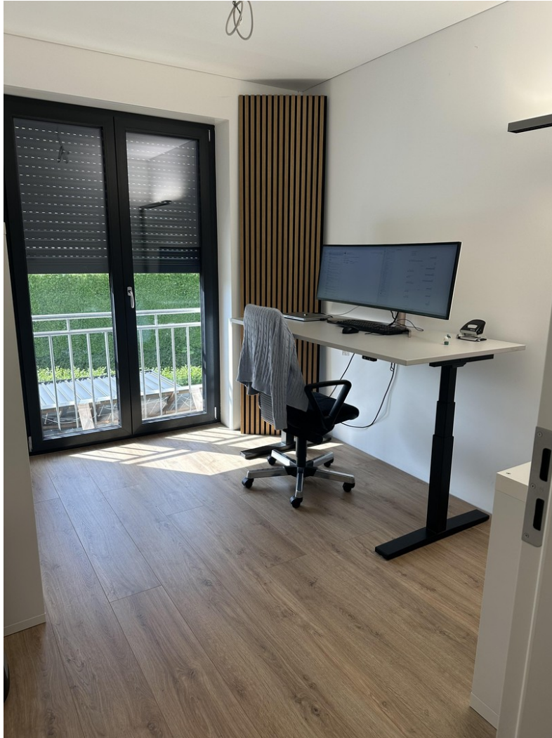
Büro / Schlafzimmer