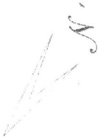
Abbildung 1 : 100