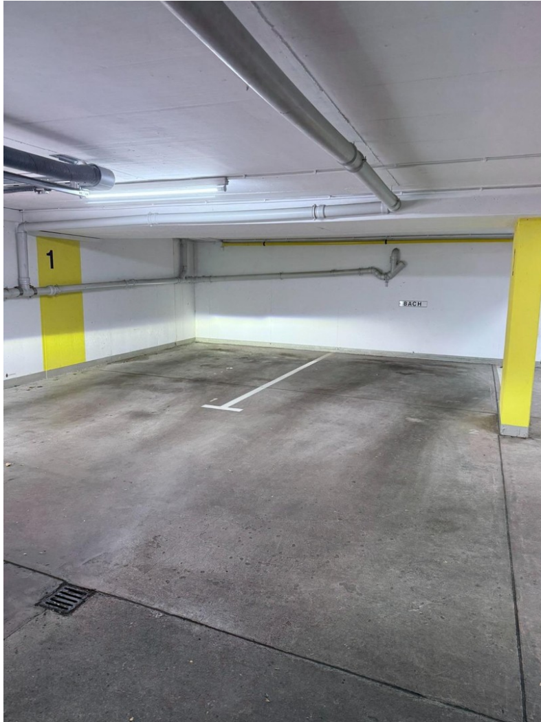
TG - STELLPLATZ