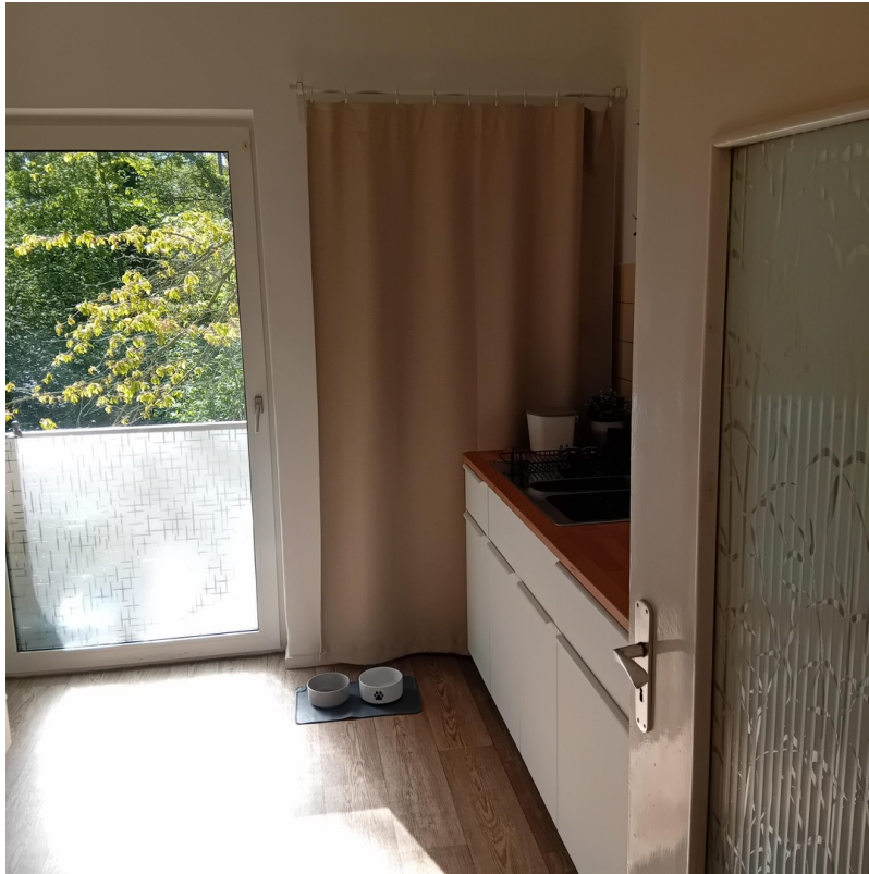
Küche mit 2. Balkon