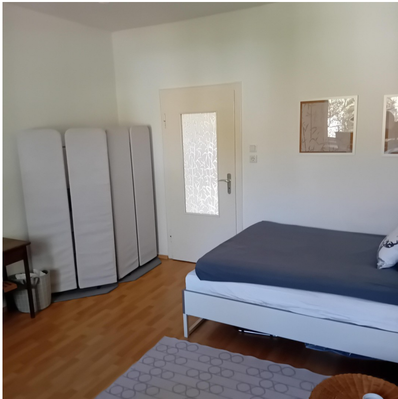
Zimmer 3 - Schlafen/Arbeiten