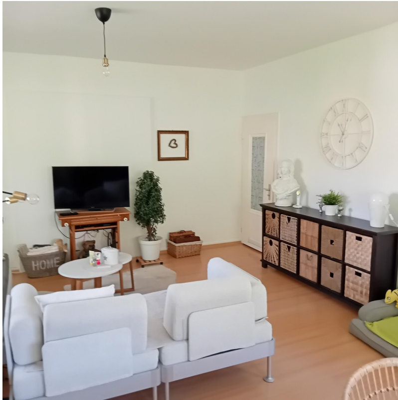
Zimmer 1 - Wohnzimmer