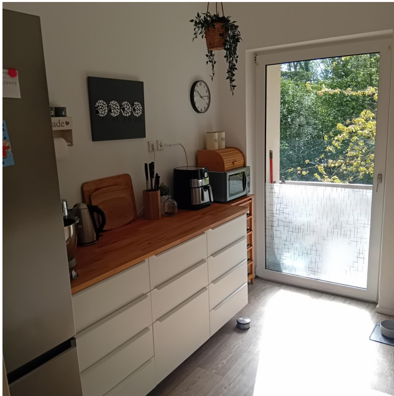
Küche mit 2. Balkon