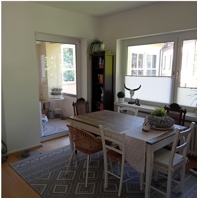
Zimmer 1 - Wohnzimmer