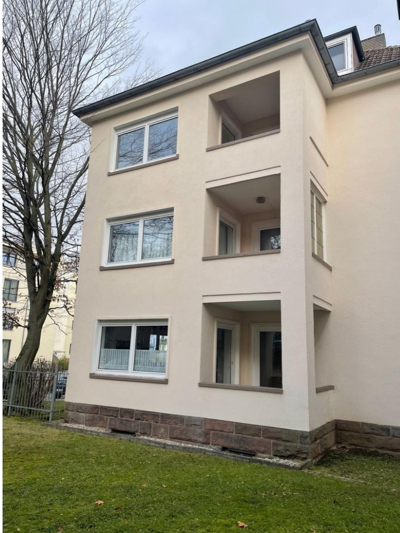
Hausansicht seitlich Balkon