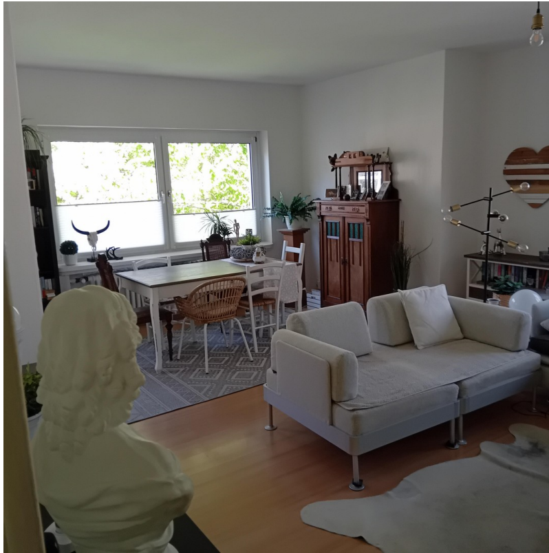
Zimmer 1 - Wohnzimmer