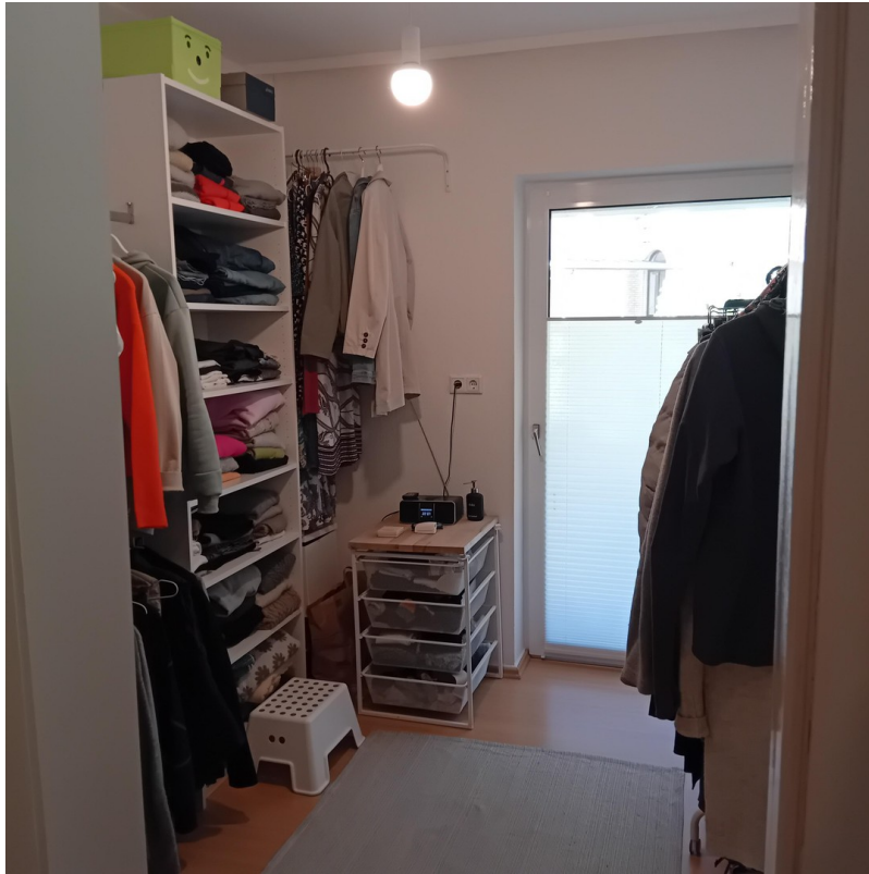
Zimmer 4 - Arbeitszimmer