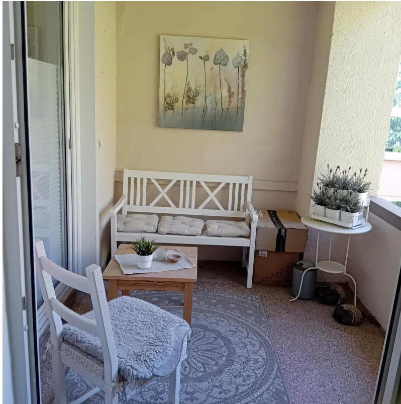
Balkon am Wohnzimmer