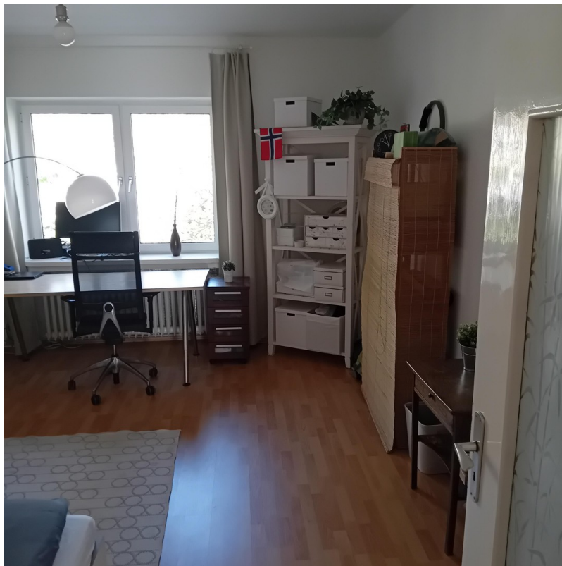
Zimmer 3 - Schlafen/Arbeiten