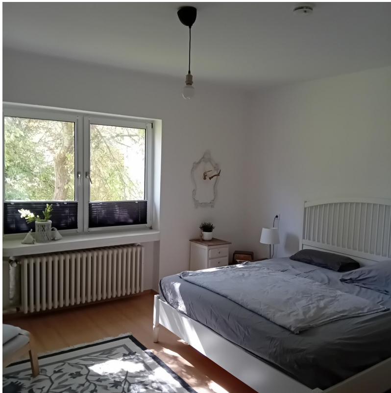
Zimmer 2 - Schlafzimmer