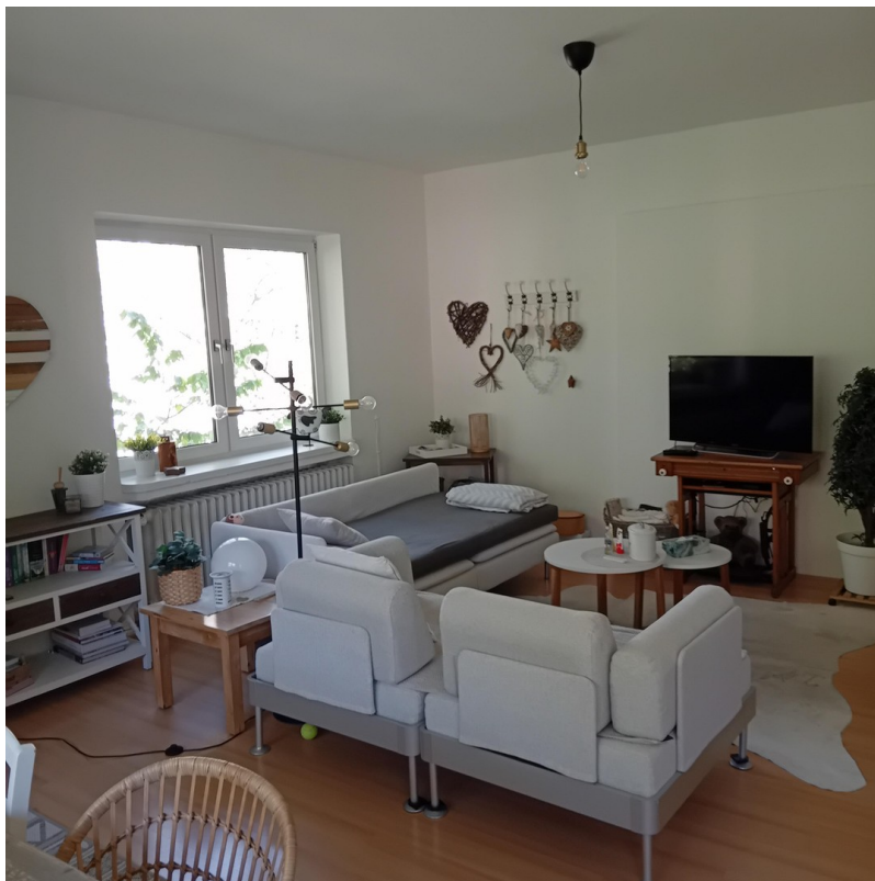
Zimmer 1 - Wohnzimmer