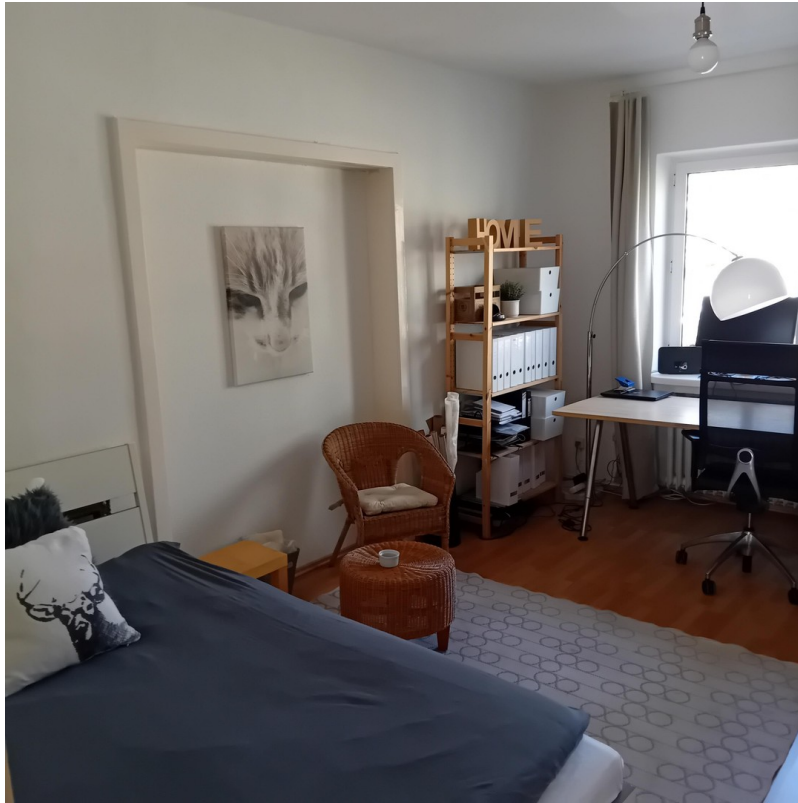
Zimmer 3 - Schlafen/Arbeiten